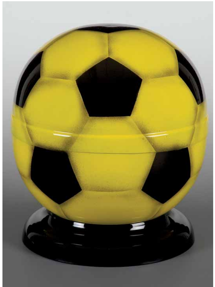
Fußballurne der Firma Heiso Metallwaren GmbH