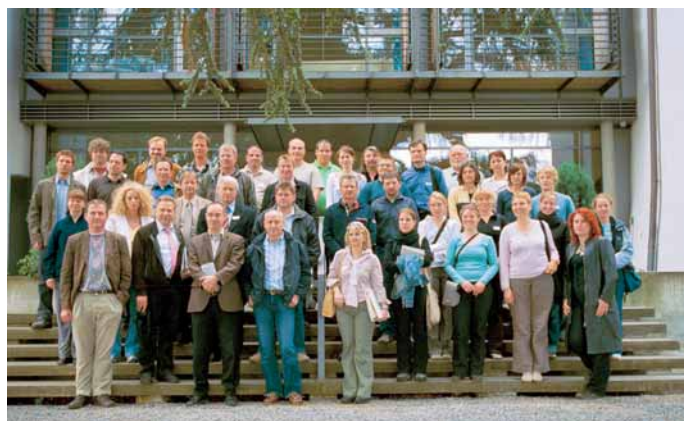
Zufriedene Teilnehmer, unter ihnen eine Gruppe von Studenten