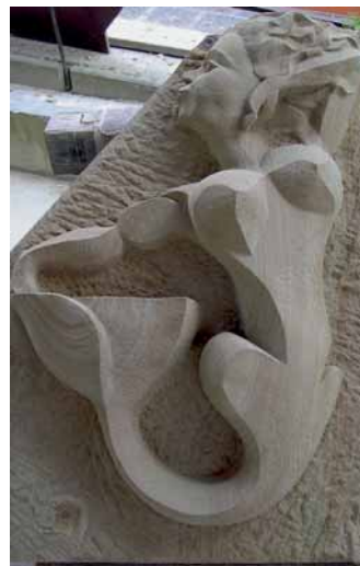
»Wandbrunnen« von Robert-John Lasker, EIFEL-SANDSTEIN

Anzeigenschluss für die Naturstein-Ausgabe 7/2006 ist der 20. Juni 2006