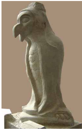
»Wasserspeier« von Nadja Hacker, UDELFANGER SANDSTEIN

che Arbeiten gefertigt. Die Steinmetzarbeitsprobe, ein Gewändeaufstand, musste in acht Stunden fertig sein. Für die Bildhauerarbeitsprobe, eine Blu-