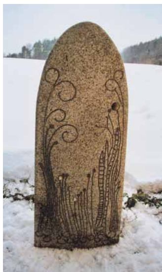
Grabmal mit floralen Ornamenten aus heimischem Granit

und kunstvollen Inschriften stellte er Bilder heutiger Friedhöfe gegenüber, darauf dick beschriftete Grabmale aus bunten Importgesteinen. Dass es auch heute anders geht, zeigte Royer anhand von Bildern von handwerklich gearbeiteten Grabmalen aus heimischen Gesteinen auf. Er erläuterte das Zusammenspiel von Stein, Symbolik, Einfassung und Bepflanzung. Beispiele vom Leitfriedhof in Nürnberg, Arbeiten des Referenten und andere Grabmale auf verschiedenen Friedhöfen lösten eine lebhaft Diskussion aus. Der Vorschlag, die Friedhofsverwaltung solle in der Satzung die Verwendung heimischer Gesteine verbindlich festlegen, fand keine Zustimmung. Die Freiheit der Auswahl war den meisten Zuhörern wichtiger. Rudolf Royer plädierte dennoch für die Verwendung