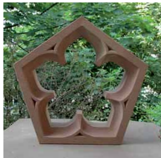
»Fünfpass« von Verena Schwarz, UDELFANGER SANDSTEIN