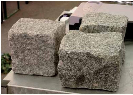
CE-Kennzeichnungspflicht – auch für Pflastersteine

15 mm (je nach Bearbeitung) betragen. Besonders schwierig sei die Einhaltung maximaler Abweichung von Vertiefungen und Erhebungen auf Sichtflächen (gespalten max. 5 mm, bearbeitet max. 3 mm). Dies bestätigte auch Dr. Brändlein; grobkörnige Granite mit großen Feldspäten oder ausgeprägter Richtungsvorgabe durch Klüftung oder Mineralienregelung ließen sich oft nicht wie gewünscht brechen. Insgesamt dürfe eine Lieferung bis zu 10 % Pflastersteine enthalten, deren Maß mehr als