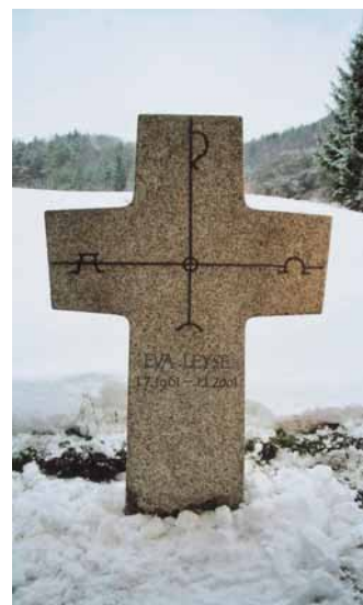
Grabkreuz mit Christuszeichen aus heimischem Granit

heimischer Materialien und eine schlichte Gestaltung. In der nahe gelegenen Steinfachschule in Wunsiedel könne man sich über Gestaltungsmöglichkeiten informieren.