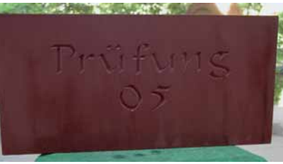
Schriftplatte »Prüfung 05«, PFÄLZER SANDSTEIN