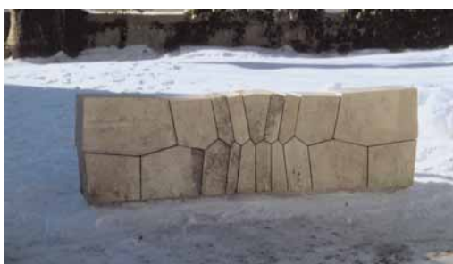
Gemeinschaftszeichen für ein kleines Gräberfeld aus heimischem Kalkstein

begonnen, den Betrieb seiner Steinbrüche im Nordschwarzwald zu modernisieren und auszubauen. Im Steinbruch Raumünzach entstanden 2002 neue Spaltwerke. In Seebach entsteht eine moderne Aufbereitungsanlage für die Produktion von Schotter, Splitt, Gemische und Wasserbausteine.