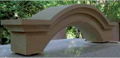
»Sturz« von Karl Schall, MEDARDER SANDSTEIN

che Arbeiten gefertigt. Die Steinmetzarbeitsprobe, ein Gewändeaufstand, musste in acht Stunden fertig sein. Für die Bildhauerarbeitsprobe, eine Blu-