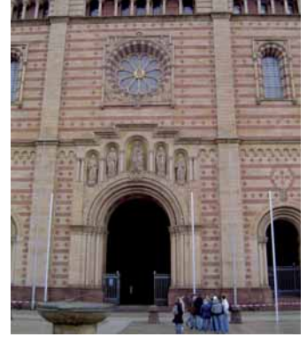
Aschaffener Meisterschüler am Speyerer Dom

Zum Auftakt standen eine Führung durch die Mathildenhöhen in Darmstadt, eine Besichtigung der Klosterhallen in Lorsch und eine Domführung in Worms auf dem Programm. Ausdauer erforderte der Aufstieg über die 253 Stufen auf einen der zwei Osttürme des Speyerer Doms am zweiten Tag der Exkursion. Nach einem anschließenden Besuch im Hochseilgarten in Ettlingen bezogen die angehenden Meister ihre Zimmer in einem Karlsruher Hotel.