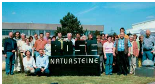
Abschließend besichtigten die Delegierten das Natursteinwerk Böse.

Wildungen verwirklichten Mutterfriedhof ein. 21 Gräber seien dort in Zusammenarbeit mit den Friedhofsgärtnern gestaltet worden, dazu drei nach vorgegebenen Lebensläufen und ein weiteres durch den Gestaltungskreis und die bundesweite Fachschule der Gärtner. Diese Mustergräber kämen bei den Besuchern hervorragend an. Der in einem englischen Gewächshaus vorteilhaft untergebrachte Beratungsstand sei fast durchwegs besetzt; so würden interessierte Besucher gut informiert. Für die Landesgartenschau habe der LIV eigens 7000 Faltblätter »DENK MAL nach« bestellt. Leider werde diese gute Information sowie mancher gute Vorschlag und manches gute Produkt des BIV von den Kollegen in anderen Regionen nicht gut angenommen. Die Besucher der Landesgartenschau könnten auch selbst Erfahrungen in der Steinbearbeitung sammeln. Der zu diesem Zweck vorbereitete Sandsteinblock sei schon ein Stück kleiner geworden. »Die Steinmetzen gestalten während der Landesgartenschau eine 2,80 m hohe Skulptur zum Thema 'Vergängliches' aus vielen 30 x 20 x 10 cm großen Einzelstücken«, informierte der LIM. Für September sei in Zusammenarbeit mit den Gärtnern