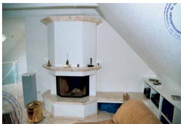
Die Kamin- verkleidung