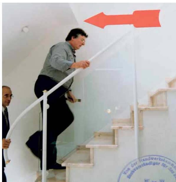
Keine 2 m Kopfhöhe!

Leistungen als mangelfrei, bot einen Nachlass an (2765 DM) und forderte einen Restwerklohn in Höhe von 40 531 DM. Alternativ schlug er vor, einen Sachverständigen einzuschalten. Der beklagte Bauherr beantragte Widerklage: Der Auftragnehmer sei ihm 27 870 DM schuldig, behauptete er und machte Mängel geltend, die er teilweise in Aufrechnung stellte. Einen Schiedsgutachter wollte er auf keinen Fall akzeptieren.