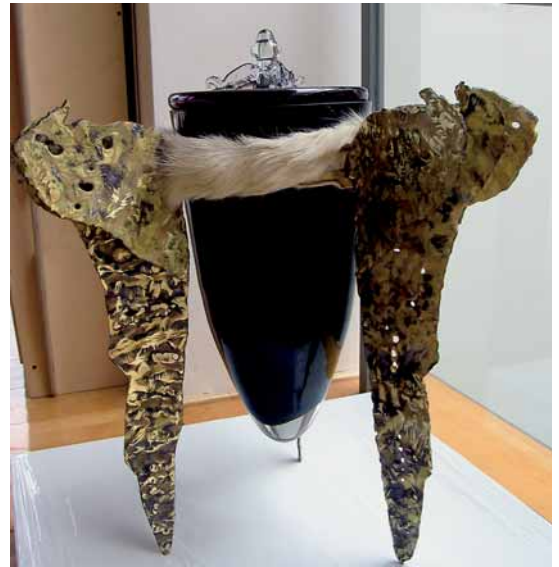
Urne »Morpheus«, zu Lebzeiten als Vase verwendbar, von Jan-Willem van Zijst und Angela van der Burght