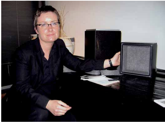
Urne »Moi« von Martine Moineau

sem Dienst am Toten die Endgültigkeit seines Todes noch einmal bewusst erleben. Die steinerne Samenschale vermittelt aber auch die Gewissheit, dass etwas geschützt und im Verborgenen überdauern wird. Der Schutzcharakter wird durch die grob gearbeitete Oberfläche verstärkt.