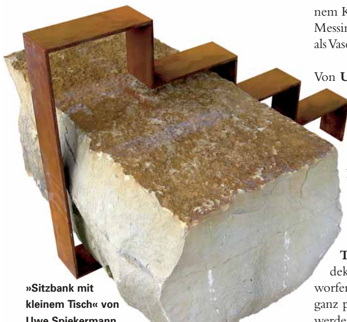
»Sitzbank mit kleinem Tisch« von Uwe Spiekermann

Weitere Informationen: www.sepulkralmuseum.de www.ausstellung-dernier-cri.de