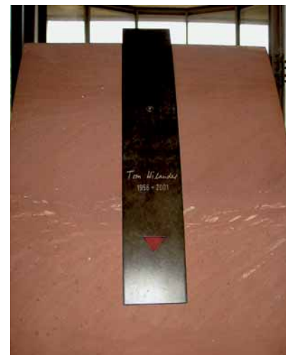
»Trio«, Inschriftenträger für ein Grabmal, abnehmbar, von Hermann Freymadl

»Wegzeichen« einfließen lassen. Ein Grabmal soll die Persönlichkeit eines Verstorbenen widerspiegeln und so lebendiges Andenken ermöglichen. Mit relativ wenigen und einfachen Ausdrucksmitteln hat Spiekermann eine große Wirkung erzielt. In den gebrauchten Basalt-Pflasterstein ist ein vergrößerter Fingerabdruck eingemeißelt und mittels Blattvergoldung farblich abgesetzt. Mit dieser Gestaltungsidee kam Uwe Spiekermann im von der Verbaucherinitiative Aeternitas veranstalteten Grabmal-Ted 2001 auf Platz 1.