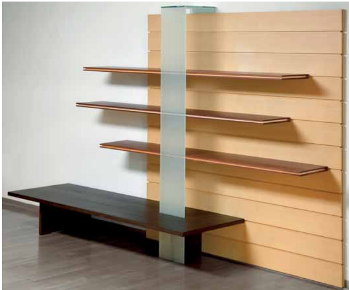
Regal, in einen Sarg verwandelbar, von Kai Oetken