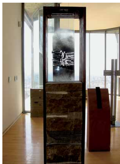
Grabzeichen von Gustav Treulieb

Bei der Gestaltung der ausgestellten Grabmale stand nicht das technologisch Machbare im Vordergrund. Die Gestalter haben sich vielmehr von formalästhetischen und inhaltlichen Überlegungen leiten lassen. Sie haben sich intensiv mit Tod und Gedenken auseinandergesetzt, ökonomische und ökologische Aspekte berücksichtigt und Zeichen geschaffen.