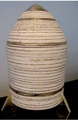
Urne »Maj. Tom« von Ulrike Struck