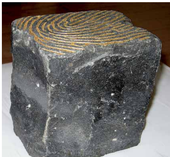
»Wegzeichen« von Uwe Spiekermann