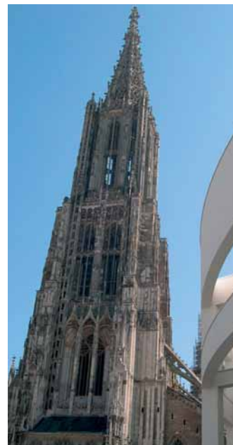
Höhepunkt des Verbandsjahrs: die Bundestagung

Am Samstagvormittag wird eine Busfahrt zur Landesgarten-