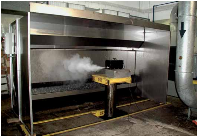
Abb. 1: Wasserwand in halboffener Bauweise (Darstellung der Absaugwirkung mit künstlichem Rauch)