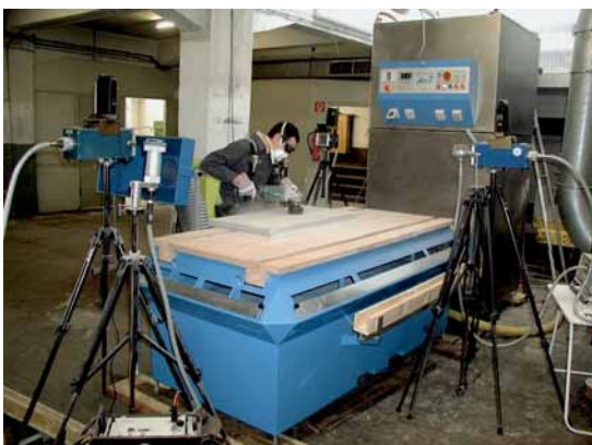
Abb. 8: Absaugtisch mit Absaugung durch ein Wasserbad

Die in der Mitte des Arbeitsraums gemessenen Konzentrationen von A- bzw. Quarzstaub lagen zwischen 50% und 100% des Durchschnittswerts der an den Absaugwänden ortsfest gemessenen Konzentrationen. Diese Ergebnisse lassen den Schluss zu, dass die Stauberfassung unzureichend ist und