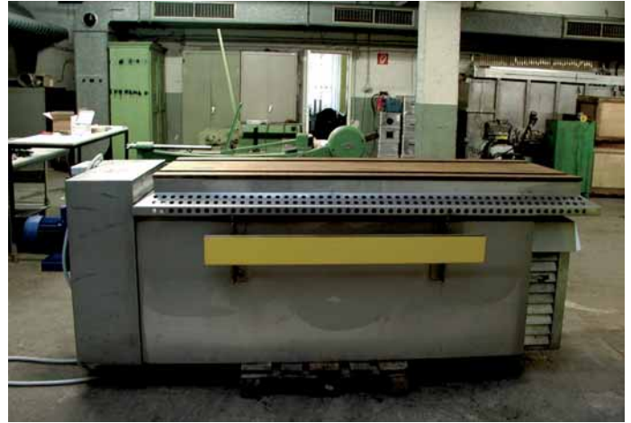
Abb. 7 : Absaugtisch mit Filtertrommel

bearbeiters und eine Messung in seinem unmittelbaren Atembereich, • bei Absaugtischen an drei Stellen des Tisches stationäre Messungen und eine Messung im unmittelbaren Atembereich des Steinbearbeiters jeweils für A- und E-Staub durchgeführt.