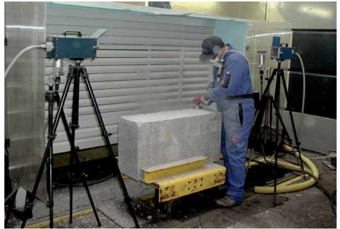
Abb. 2: Absaugwand mit Filtertrommelsystem