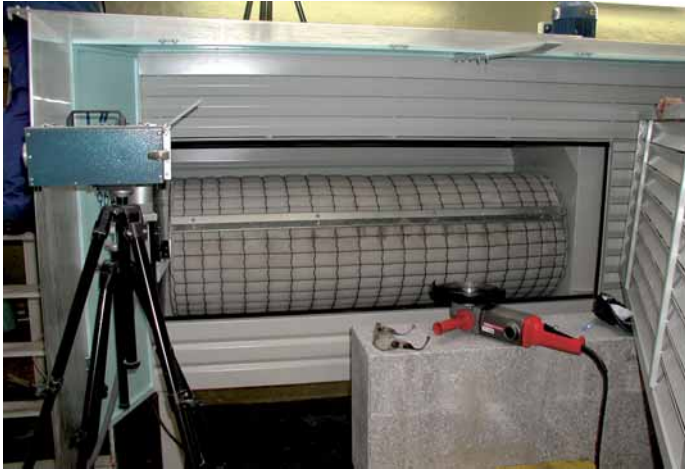
Abb. 6: Filtertrommel einer Absaugwand