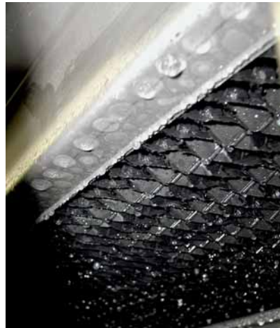
Abb. 4: Tropfenabscheider