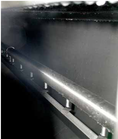
Abb. 3: Wassersprührohr innerhalb des Luftkanals