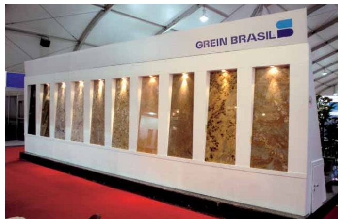
Der 150 m 2 große Messestand der Firma Grein Brasil, die viele Materialien präsentierte