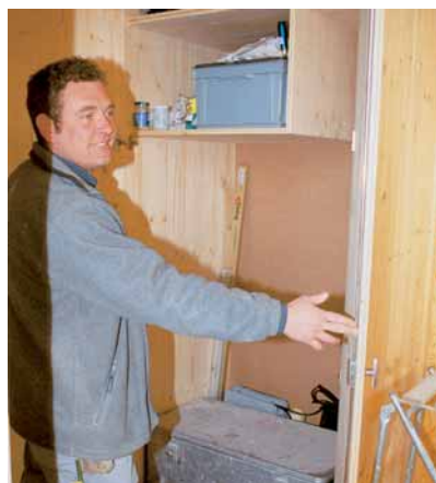
Eigenes Werkzeug, eigener Spindel!

Gas. Von Interesse ist v. a. die Grundausstattung der Halle und die Anordnung der Maschinen im Raum – verwirklicht in Zusammenarbeit mit der Mobil Werkstätte Josef M. Greber. Die Halle ist befahrbar. Mit dem Hallenkranssystem lässt sich jeder Punkt erreichen. Der Boden hat ein Gefälle. Das bei der Produktion anfallende Wasser fließt in eine Rinne und wird der mittig platzierten Wasserreinigungsanlage zugeführt. Nach der Reinigung wird es wieder verwendet. Außerdem sind auf der ganzen Hallenlänge Luft, Wasser und Gas verfügbar.