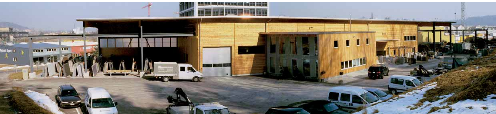
Der neue Firmensitz in Winterthur