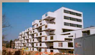
Genossenschaftliche Wohnanlage in Zürich: 5 000 m 2 Bodenbeläge (Bahnen, 12 mm stark, 30 cm breit, freie Längen) in PERLATO SICILIA