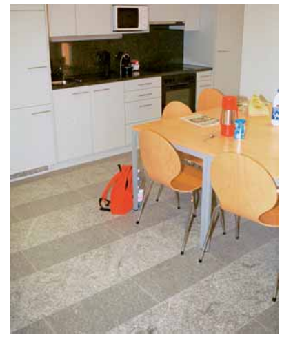
Mitarbeiterküche mit Natursteinboden

Gas. Von Interesse ist v. a. die Grundausstattung der Halle und die Anordnung der Maschinen im Raum – verwirklicht in Zusammenarbeit mit der Mobil Werkstätte Josef M. Greber. Die Halle ist befahrbar. Mit dem Hallenkranssystem lässt sich jeder Punkt erreichen. Der Boden hat ein Gefälle. Das bei der Produktion anfallende Wasser fließt in eine Rinne und wird der mittig platzierten Wasserreinigungsanlage zugeführt. Nach der Reinigung wird es wieder verwendet. Außerdem sind auf der ganzen Hallenlänge Luft, Wasser und Gas verfügbar.