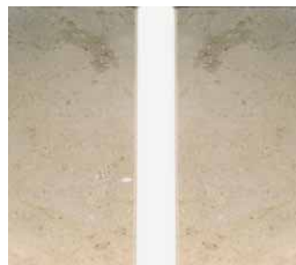
Mit Ottoseal-StainEx gereinigter Naturwerkstein

wird »Ottoseal StainEx« auf die zu reinigende Fläche aufgetragen, eingearbeitet und erneut so aufgetragen, dass die Paste mindestens 5 mm dick auf der geschädigten Fläche steht. Sobald die Paste vollständig getrocknet ist, werden die verbliebenen Feststoffe einfach abgekehrt oder abgesaugt. Bei tief eingedrungenen Verfärbungen kann der Vorgang wiederholt werden. Ein technisches Datenblatt gibt wichtige Hinweise zur Verarbeitung. Zur anschließenden Neuverfugung bietet Otto ein abgestimmtes Komplettsortiment.