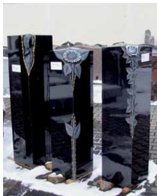
Hausmesse bei der Firma Groll: Grabmal aus dem Sandstein REGENBOGEN und mit Blattgold verzierte Grabstelen