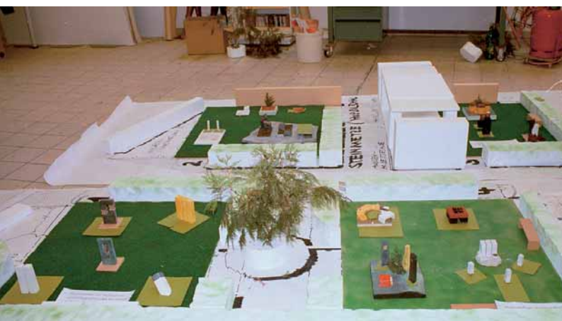
So soll es werden! Gesamtansicht und Einzelansichten der geplanten Mustergrabanlage (400 m 2 ); insgesamt wird der Ausstellungsbereich »Grabgestaltung« 2000 m 2 groß.