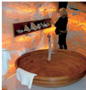
Hinterleuchteter Onyx von Kästner Natursteine

Die Onyxplatten werden auf einer Rahmenkonstruktion punktweise auf Abstand befestigt. Die