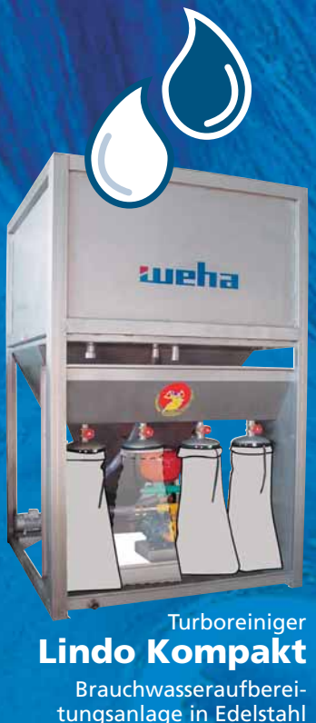
Turboreiniger Lindo Kompakt

Brauchwasseraufbereitungsanlage in Edelstahl