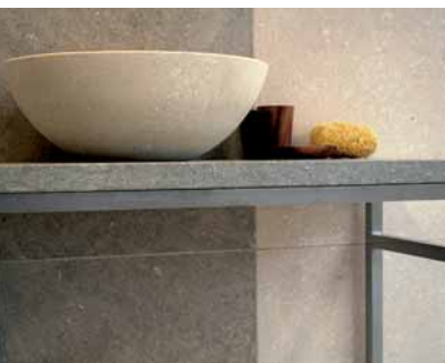
Limestone-Gestaltung in BIANCO AVORIO

Naturstein + Dekor Koop Handelsges. mbH Stawedder 31 25462 Rellingen Tel.: 041 01/4 78 90 Fax: 041 01/47 89 18/19 E-Mail: info@naturstein-dekor.de Internet: www.naturstein-dekor.de und www.house-of-limestone.de