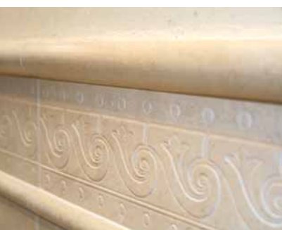
TOSCANA, REBECCA VELLUTO