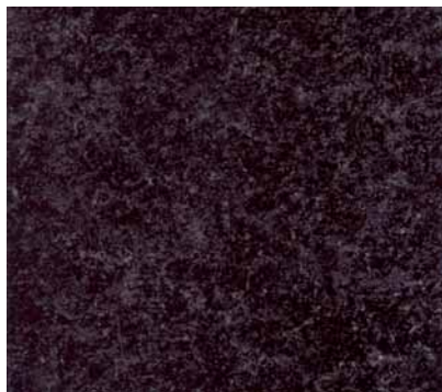
SAN GABRIEL BLACK