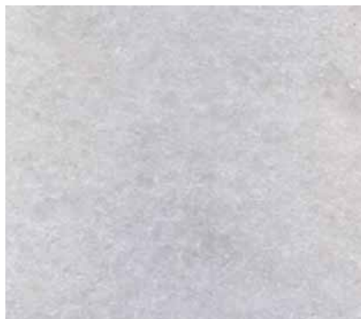
EXTRA CLASSIC WHITE MARBLE