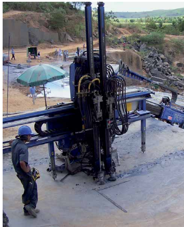
Abbau von SAN GABRIEL BLACK

1100m 3 pro Monat; 2007 will sie 2000m 3 pro Monat abbauen. Die Ausbeute liegt bei 28% der gebrochenen Steinmenge; die Blöcke messen ca. 290 x 240 x 120cm. 30% der Blöcke werden exportiert. Halbfertig- und Fertigware wird im Werk von Marbrasa in Cachoeiro produziert (240000 m 2 /Monat; zweischichtige Produktion mit Gattern von Barsanti und einer Polierstraße von Breton); in den nächsten fünf Jahren soll ein zu-