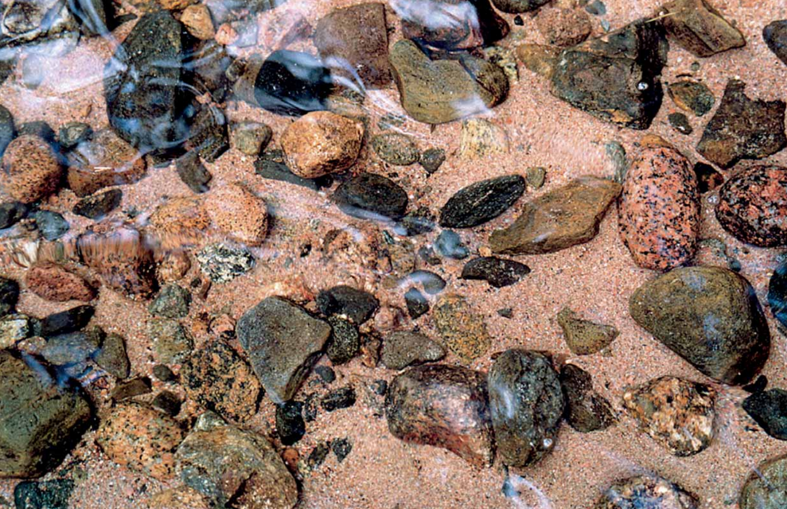
Savitaipale: Steine im Wasser