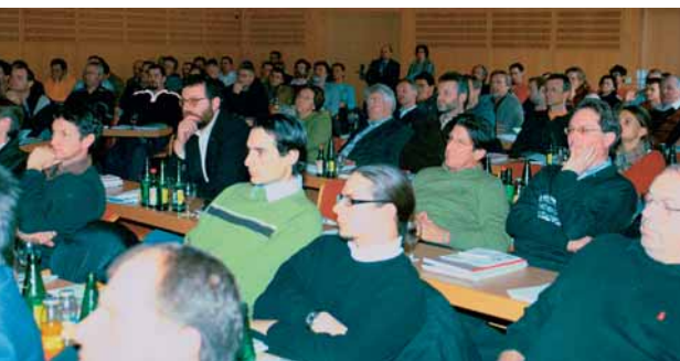
An die 100 Steinmetzen kamen zu dem Treffen.

Am Abend fand ein so genanntes Kamingespräch statt. In kleiner Runde und gemütlicher Atmosphäre diskutierten Steinmetzen aus Deutschland und Österreich sowie Vertreter von österreichischen Denkmalpflege-Behörden über Probleme bei der Denkmalpflege. Tenor des Austauschs: In beiden Ländern ist es nicht einfach, ungeeignete Firmen von Vergabeverfahren auszuschließen. Schwarze Schafe gibt es überall und Qualitätssicherung ist das oberste Gebot.