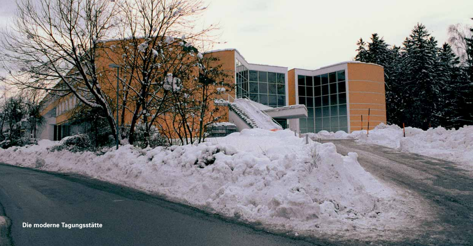
Die moderne Tagungsstätte