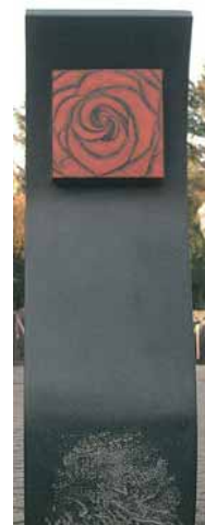
Grabmal-Ted- Gewinner 2005: Stele aus SSY