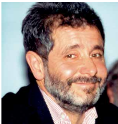
Abb. 1: Prof. Dr. Rolf Snethlage (Venedig 1993)

Im Wintersemester 1963/64 immatrikulierte sich Rolf Snethlage an der Naturwissenschaftlichen Fakultät der Ludwig-Maximilians-Universität München (LMU) und legte 1970 die Diplomprüfung im Fach Mineralogie ab. 1974 wurde er aufgrund einer lagerstättenkundlich ausgerichteten Dissertation zum Dr. rer. nat. promoviert. Sein »Doktorvater« war Dietrich D. Klemm ( Abb. 3 ), der sich innerhalb eines breiten Spektrums angewandt-geologischer und mineralogischer Forschungen auch mit Problemen der Archäometrie und Steinrestaurierung auseinandergesetzt hat. Als erster publizistischer Nachweis der Aktivitäten von Rolf Snethlage zur Erhaltung von Denkmälern liegt ein »Bericht über die Steinrestaurierung am Bayer-Tor in Landsberg am Lech« (Maltechnik, Restauro 4/1977) vor, den er gemeinsam mit D. D. Klemm und dem Restaurator B. Graf verfasst hat. Diese Publikation ist auch eines der frühesten Beispiele für die