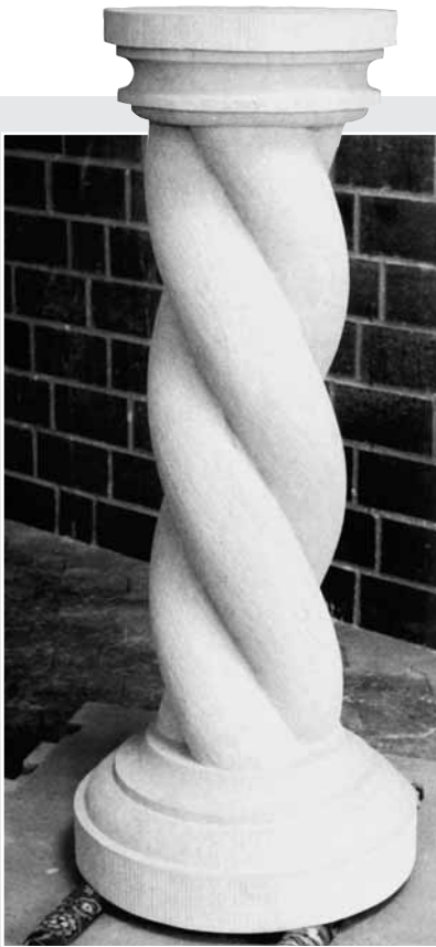
Heiko Burkhardt: Säule, ca. 1,35 m hoch; PIETRA BATEIG, frei vom Hieb