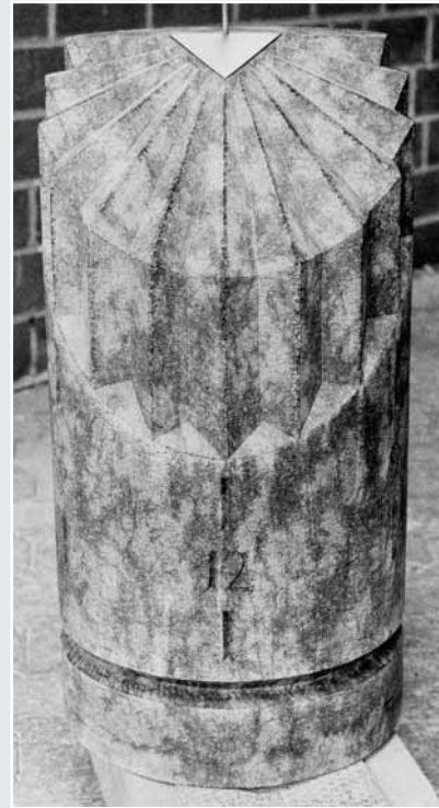
Martina Stumpf: Sonnenuhr, ca. 1,00 m hoch; DIABAS, frei vom Hieb und angeschliffen