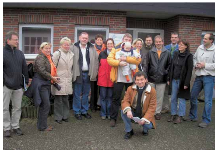
ERFA-Kreis »Mitte«: Gruppenbild mit Nachwuchs