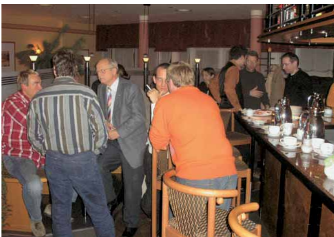
Nicht zu unterschätzen: der Wert des informellen Austauschs

dungszentrum Mainz-Hechtsheim in der Meisterausbildung tätig war und schon erfolgreich ERFA-Kreise für Becker betreut. Im vergangenen Jahr hat er in Abstimmung mit dem Bundesinnungsverband zwei ERFA-Kreise für Steinmetzen organisiert. Jeweils ca. zehn Steinmetzunternehmer treffen sich jetzt zweimal pro Jahr für zwei Tage. Sie besichtigen gegenseitig ihre Betriebe, wobei sie die Produktion, die Präsentation, die Verwaltung und Baustellen »unter die Lupe« nehmen. Außerdem werden die betriebswirtschaftlichen Kennzahlen der einzelnen Betriebe errechnet, gemeinsam erörtert und