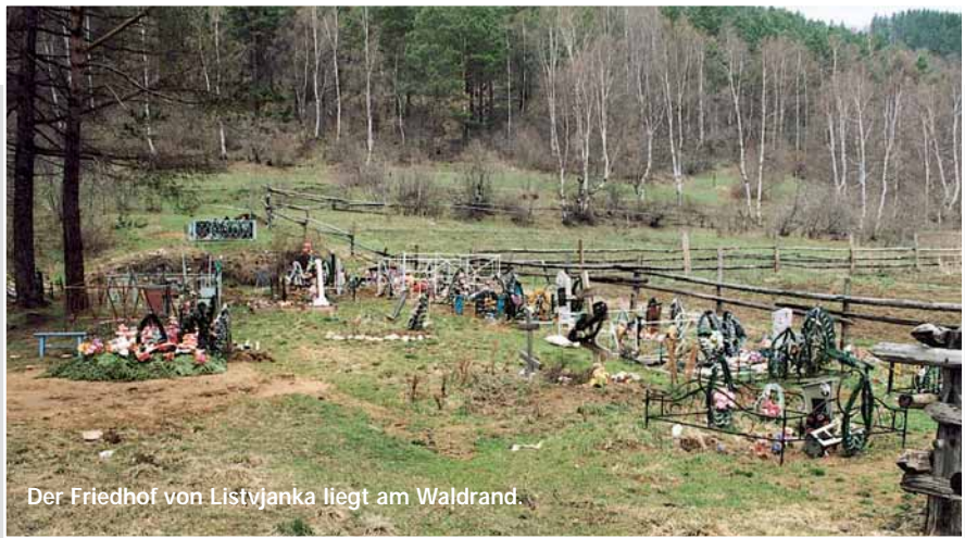
Der Friedhof von Listvjanka liegt am Waldrand.

Unser Autor Dr.-Ing. Dieter Gerlach hat uns Bilder von einer Reise nach Russland mitgebracht. Dieser Friedhof gehört zu Listvjanka, einem Ort am Baikalsee. Hier scheinen Friedhofs- und Bestattungskultur besonders im Argen zu liegen.