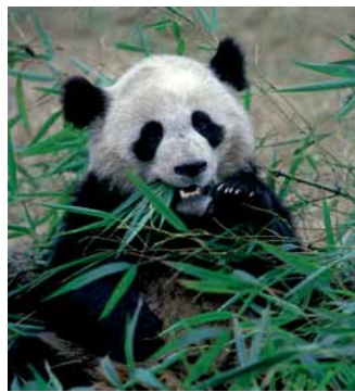
Ein großer Panda

Shanghai; Inlandsflüge; DZ in Hotels der gehobene Kategorie; täglich Frühstück und zweimal Abendessen; Visabesorgung; Reisepreis-Sicherungsschein. Preis: 1 998 € (+ evtl. Kerosin-Zuschlag); Zuschlag EZ: 298 € Anmeldung bis 1. März bei: Kolping Tours Augsburg Tel.: 08 21 / 3 44 32 41