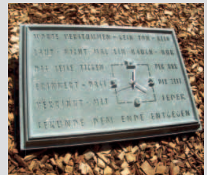
Wanduhr aus ANRÖCHTER DOLOMIT von Sascha Bollerhey aus Hessen