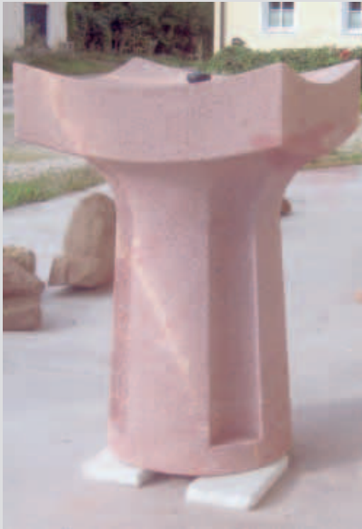
Brunnen aus ROCHLITZER PORPHYR von Daniel Steinert aus Bayern