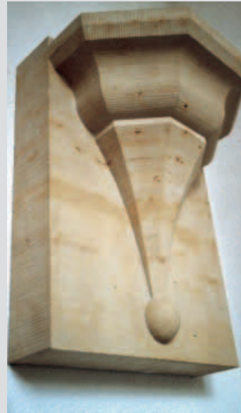
Konsole aus SEEBERGER SANDSTEIN von David Steinbrück aus Thüringen