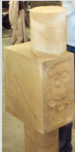
Kindergrabmal aus POSTAER SANDSTEIN von Guido Martin aus Berlin