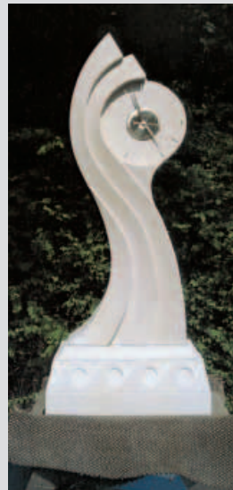
Standuhr aus OBERNKIR- CHENER SANDSTEIN von Aaron Kunst aus Bremen