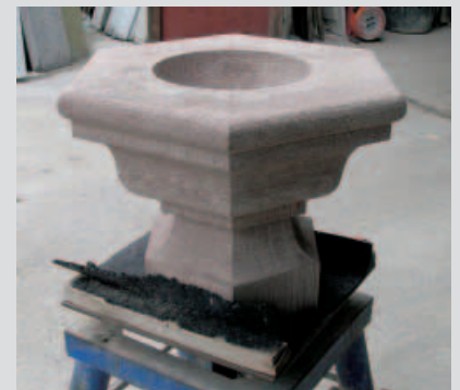
Pflanzschale aus Mainsandstein von Matthias Bell aus Rheinland-Pfalz