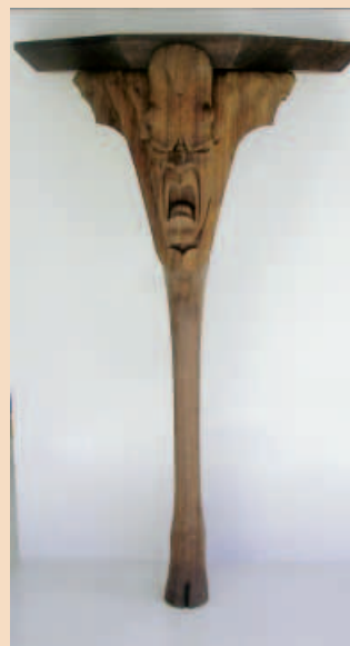
»Konsoltisch« von Freia Styba