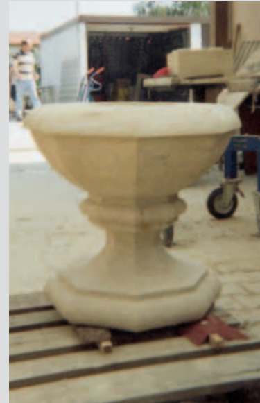
Pflanzschale aus COTTAER SANDSTEIN von Aron Rauschenhardt aus Sachsen

rald Berg an. Sie musterten die Arbeitsproben genau und vergaben entsprechend Punkte. Bis schließlich alle Punkte addiert, nachgerechnet, gegengerechnet und übertragen waren, war es draußen schon dunkel geworden und die Teilnehmer saßen in wachsender Spannung im Theorie-raum beisammen.