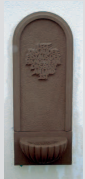
Wandbrunnen aus Eifeler Sandstein von Matthias Becker aus dem Saarland