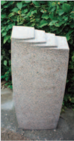
Grabstele aus BOHUS ROT von Niels Volquardsen aus Schleswig-Holstein