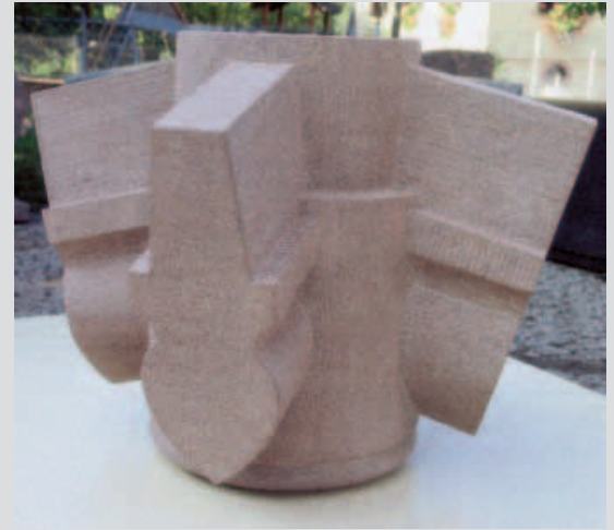
Schlussstein aus Sandstein von Ralph Hoffmann aus Bayern

vergingen. Fast alle hätten gut noch eine weitere Stunde an ihre Stücken feilen können um die anspruchsvolle Aufgabe perfekt zu erledigen. Die Aufgabe war so konzipiert, dass sich