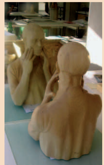
»Stillstand« und Spiegel von Simeon Decker