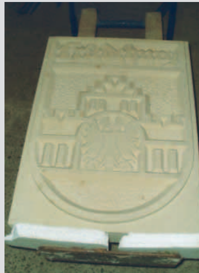
Wappen der Gemeinde Friedeburg aus BENTHEIMER SANDSTEIN von Dirk Wolken aus Niedersachsen