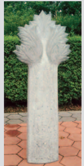
Stele mit Blattmotiv aus LIMESTONE von Waldemar Steingraber aus Niedersachsen