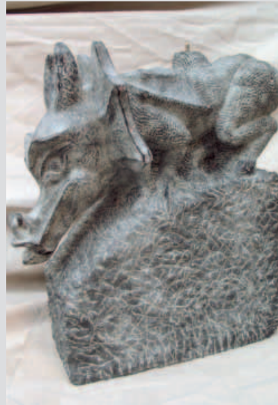
Fabelwesen aus Diabas von Ramona Schütte aus Rheinland-Pfalz