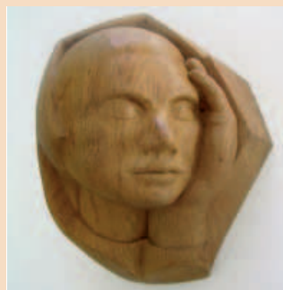
»Schlafende« von Sarah Redlich