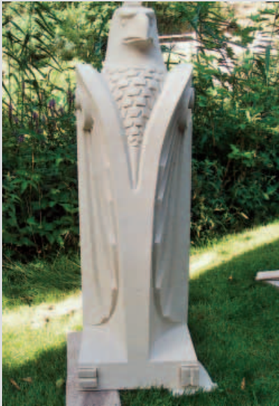
Steinwächter aus WALDECKER SANDSTEIN von Christian Schmitt aus Hessen