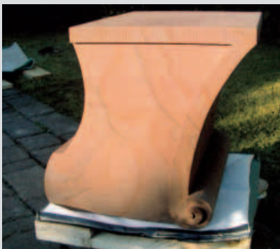
Gerätetisch aus KYLLTALER SANDSTEIN von Frank Förster aus Nordrhein-Westfalen.