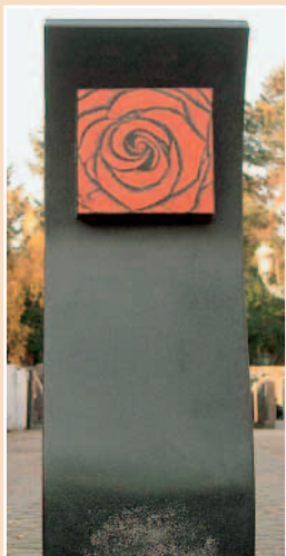
»Zeichen der Liebe«. Die Seitenflächen des 15 cm dicken Steins wurden zurückgesetzt um eine Leichtigkeit zu schaffen. Das Rosenornament sollte so natürlich wie möglich erscheinen. Mattschliff, Untergrund der Rose poliert, Seitenflächen hinten: grob geschurt, 30 x 95, x 15 cm, SSY

Die Pressearbeit in Sachen Grabmal-Ted wolle man nicht auf Negativaussagen über die Massenware gründen. Man werde, so versicherte Weber, keine Medienpräsenz auf Kosten anderer schaffen.