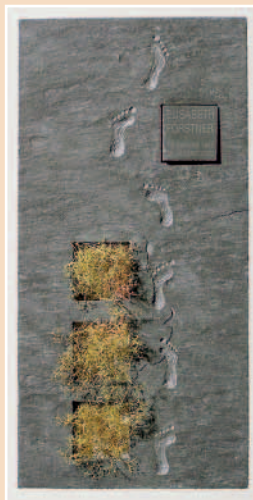
»Spuren«. Die Skulptur definiert ein offenes Volumen – Sinnbild für die vielen guten, gemeinsamen Erlebnisse, die in den Herzen weiterleben. Die verstorbene Person hinterlässt Spuren. Aus den Pflanzenfeldern werden die Fußabdrücke im Laufe der Zeit langsam überdeckt. 200 x 100 x 15 cm, GUNTLIWEIDER HART-SANDSTEIN