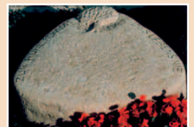
»Liegeplatte«, Baum, symbolisch für Werden und Vergehen, Kreislauf des Lebens, gespitzt, gestockt und angeschliffen, 45 x 45 x 18 cm, Bronzett-Kalkstein