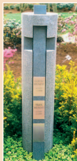
»Kreuzsäule«, oben und außen geflammt, Mittelteil und Aufsatz geschliffen, C220, mit eingelassenen V4A-Platten, sichtbare Innenfläche frei vom Hieb, 133 x 30 cm, IMPALA