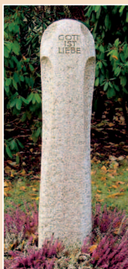
»Kubische Stele« zum Thema Wege bzw. Lebenslinien, gespitzt, gestockt und angeschliffen, 25 x 25 x 115 cm, Harzer Granit