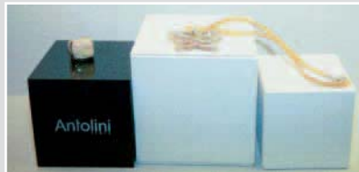
Die Firma Antolini Luigi ist ihrem Messemodemotto »Weniger ist mehr« treu geblieben. Die jungen Damen präsentierten sich »schmuck«.