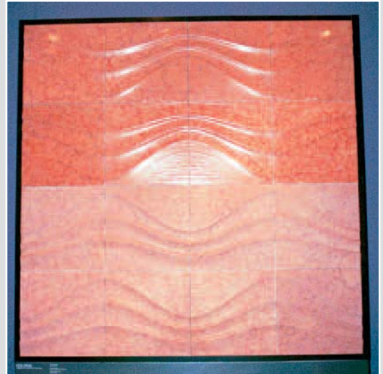
Von Testi Fratelli gefertigtes grafisches Relief, wandhoch, aus ROSSO VERONA, Design: Pongratz Perbellin Architects

Granitglasplatte unter Wasser!) präsentierte die Firma Grein Tec zusammen mit der Firma Planolux (Beleuchtungstechnik). Die innovative Firma war nicht nur in einer Messehalle, sondern auch in der großen Ausstellung »Citadella di Marmo Art Cultura« im Palaexpo-Gebäude über dem Messeingang präsent. Dort hatte sie ihr Produkt im wahrsten Sinne des Wortes auf die Bühne gebracht: Ein Pianist und ein Cellist spielten vor einer hinterleuchteten Granitglaswand (Granit RED MULTICOLOR).