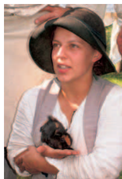
Momo aus der VoCo