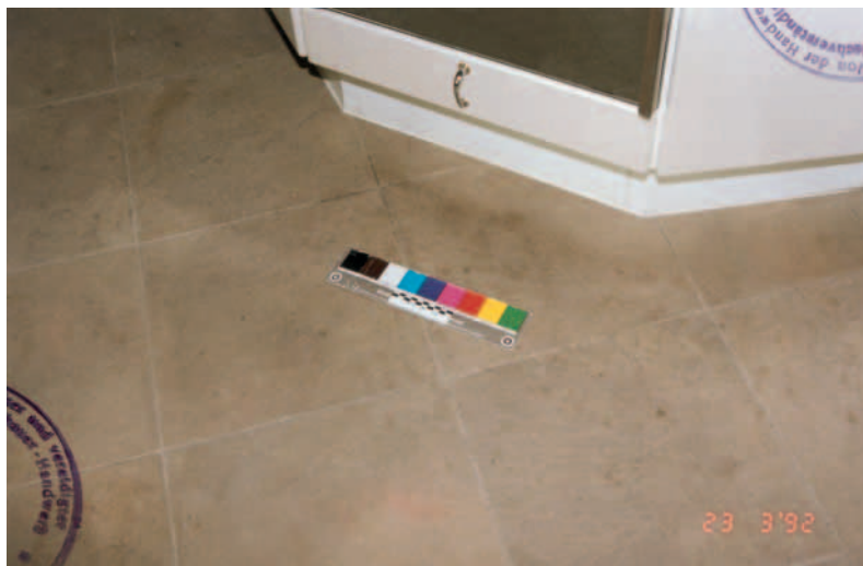
Fleckenbildung vor dem Herd

aus wie auf einem Bahnsteig, beschwerte sich der Bauherr beim Ortstermin. Die Fettflecken gingen nicht raus und so sei er sehr über den Boden verärgert.