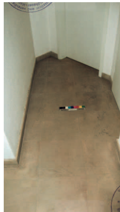
Verfleckung im Flur