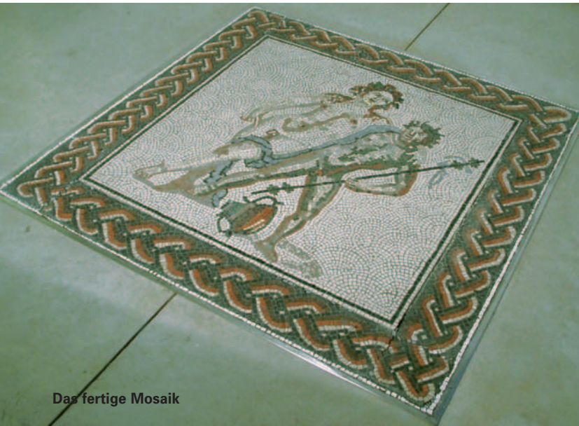
Das fertige Mosaik