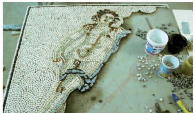
Das Replikat wurde aus 25 000 Steinchen zusammengesetzt.