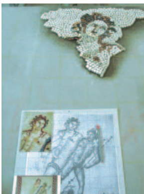
Eine schwarz-weiß-Kopie diente als Vorlage.

werden. Das zentrale Bildfeld des Replikats zeigt den Gott Dionysos im Tanz mit einer Mänade, die einen Tyrosstab in der Hand hält. Am Boden erkennt man einen umgestürzten Weinbecher. Die Maße des zentralen Bildfelds inklusive Schmuckband betragen ca. 1,50 m x 1,50 m, die Gesamtfläche ca. 2,25 m 2 . Dieser Umfang ergab bei einer Mosaiksteingröße von ca. 8 mm und entsprechendem Fugraum einen Bedarf von ca. 25 000 Mosaiksteinen.