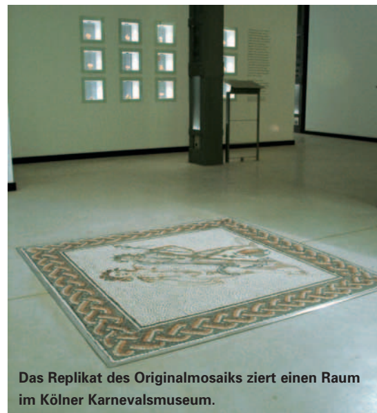
Das Replikat des Originalmosaiks ziert einen Raum im Kölner Karnevalsmuseum.

Diese Mosaiksteine wurden aus ca. 8 mm starken Natursteinen mit Hammer und Zange gebrochen. Um den Eindruck des antiken Mosaiks wiederzugeben, benötigten die Verleger verschieden große Mosaiksteine, z. B. um Konturen zu legen.