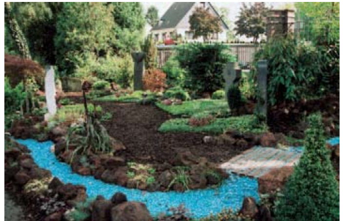
Die Mustergrabanlage auf dem Kalker Friedhof in Köln

serlauf aus hellblauen Glascherben, zufällig verteilte Lava- steine und eine abwechslungsreiche Bepflanzung. Innerhalb dieser gärtnerisch gestalteten Anlage sind die sieben Grabmale der Kölner Steinmetzen unregelmäßig verteilt. Mehr dazu in der nächsten Ausgabe von Naturstein .