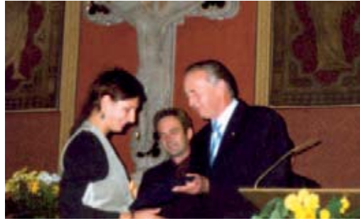
Freisprechungsfeier in der Pauluskirche