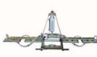
Der VAM 4 PN / 500 TK

Material, egal ob mit polierter, gesägter, rauer, beflammter, gebürstete oder gestockter Oberflächen. Sie können einzeln verschoben, um 90° gedreht oder abgesperrt werden. Auch Arbeitsplatten mit Ausschnitten oder kleinere Platten lassen sich somit problemlos heben. Das Ansaugen bzw. Lösen des Vakuums wird über ein Sicherheitsgleitventil mit Blockierung gesteuert. Für den sicheren Transport sind alle Vakuum-Heber mit einem intelligenten Sicherheitssystem ausgestattet. Sobald das Vakuum die Toleranzgrenze unterschreitet, werden sowohl ein akusti-