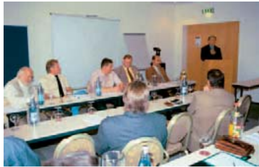
Der LIV-Vorstand und Staatssekretär Rudolf Bohn

es der Landesvorstand nicht leicht und sei besonders auf die Zu- und Mitarbeit der Mitglieder angewiesen. Havlicek forderte die Kollegen zur Beteiligung am geplanten Musterfeld auf der Landesgartenschau 2006 in Wernigerode auf. Er bat auch darum, weiter auszubilden und damit zur Zukunftssicherung beizutragen. »Die Kunden werden immer anspruchsvoller«, sagte er. Diesen Ansprüchen könnten nur gut ausgebildete Fachkräfte entsprechen.