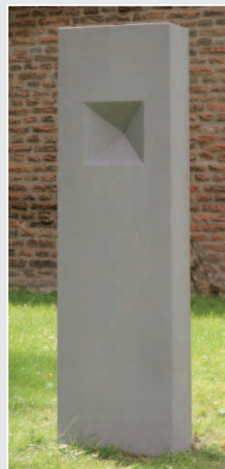
Stele, Graugrüner Sandstein, geschliffen, 143 x 40 x 20 cm, von Markus Weisheit, Siegburg