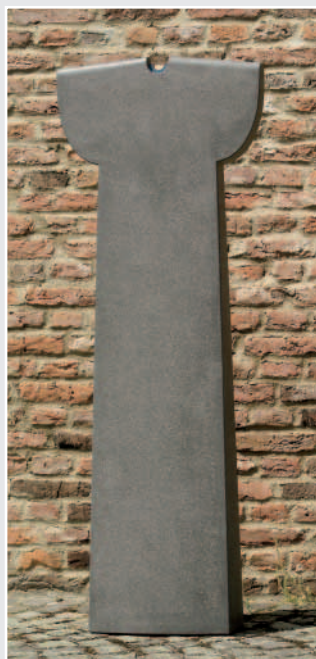
Stele mit Sonnensymbol, Dolerit, schwarz, 157 cm hoch, von Tim Bretschneider und Thomas Hundhausen, Remscheid