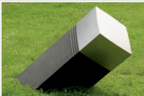
»Prismatoid«, Dunkler Granit, Edelstahl, 115 x 38 x 38 cm, von Udo Wintgens, Duisburg