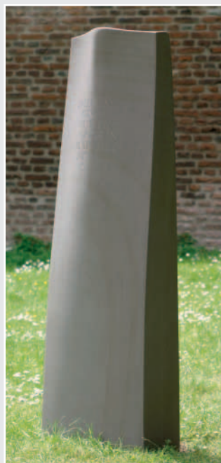
»Stele mit anthropomorpher Form«, Grauwacke, fein geschlif- fen, 48 x 151 x 25 cm, von Jörn Schulze-Kroschel, Bonn