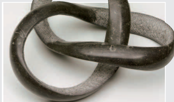
»Möbiusband«, BELGISCH GRANIT, von Guido Schneidermann-Abdechak, Wesel-Bislich