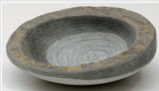
»Schale – Steinobjekt«, Schiefer, 42 x 17 cm, von Markus Schürmeyer, Köln