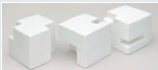
»ausgeklinkt«, LAASER MARMOR, je 25 x 25 x 25 cm, von Gregor Schulte, Möh- neseen