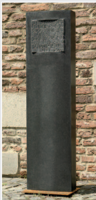
Stele (konvex, Schriftkörper konkav), Afrikanischer Granit, 137 x 35 x 15 cm, von Wendel Wollweber, Goch