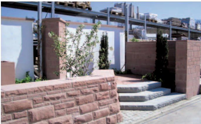
Der Garten »Stein«