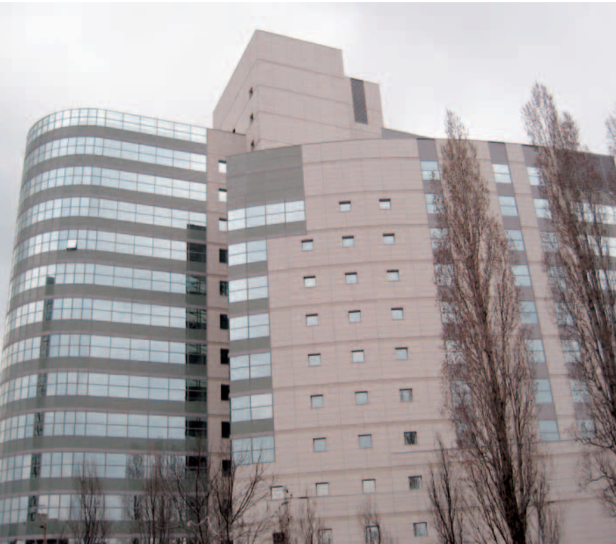
Die Granitfassade am Hoto-Tower hängt an einer Unterkonstruktion aus Aluminium und besteht aus rund 3500 Platten à 185 cm x 55 cm x 2,5 cm.