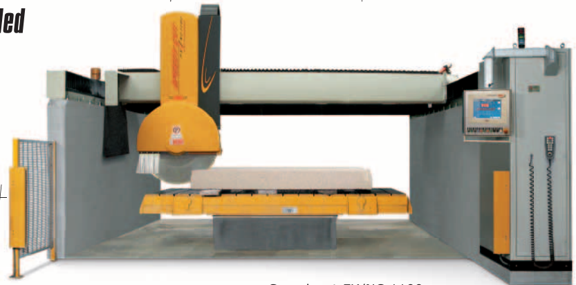
Speedycut FK/NC 1100

No doubt there's the right machine for you!