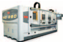
Contourbreton NC 260