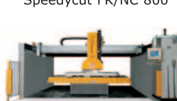
Speedycut FK/NC 800