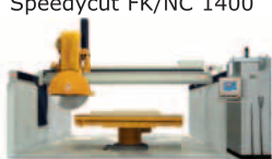
Speedycut FK/NC 1400