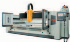
Contourbreton NC 399