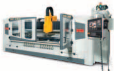
Contourbreton NC 250