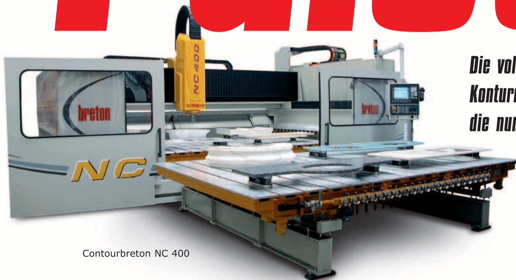
Contourbreton NC 400

Die vollständigste Palette von Konturmaschinen und Brückensägen, die numerisch gesteuert werden.