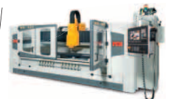
Contourbreton NC 121

Zweifellos findest Du die richtige Maschine für Dich!