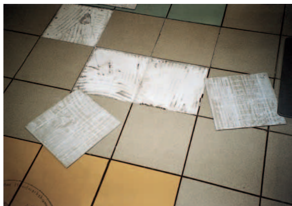
Gelöste Bodenplatten ohne Haftverbund

In der Folgezeit ließ der Generalunternehmer die Bodenfläche incl. Unterbau durch einen anderen