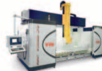
Contourbreton NC 1300/2T