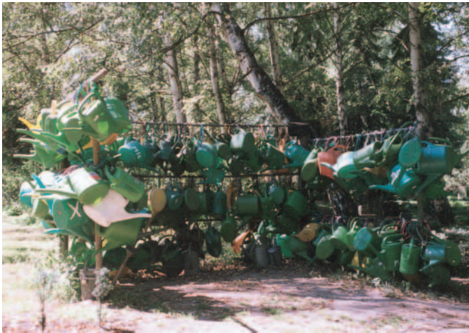
Kunst auf dem Friedhof