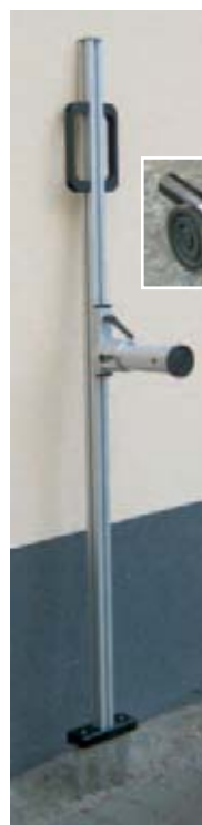
Das Prüfgerät mit Hebelarm

»Artex« ist in fünf Versionen erhältlich: »Artex I« eignet sich zur Reinigung von Marmor, Mauerfresken und empfindlichen Trägermaterialien. Es verändert Kalkstein nicht und schont alte Pigmente. »Artex II und III« eignet sich zur Reini-