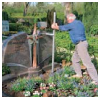
So wird die Standssicherheit geprüft.

Isis-Junior überzeugt laut Firma durch seine kompakte Bauweise. Die komplette Messtechnik ist in den robusten und witterungsgeschützten Kraftsensor integriert. Mehrstufige akustische Tonsignale zeigen den aktuellen Belastungszustand an. Ein dazugehöriger vertikaler Aluminium-Hebelarm erleichtert das Aufbringen der Prüfkraft. Der Hebelarm wird entweder mit einer Erdgabel