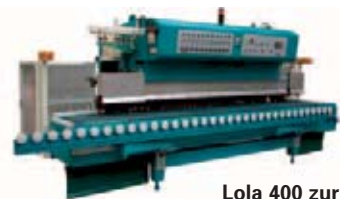
Lola 400 zur Bearbeitung von geraden Kanten

Die Firma Montresor präsentiert auf der Marmomacc Kantenschleifautomaten live in Aktion: Lola 400 für die Bearbeitung von geraden Kanten und den Kantenschleifautomaten Luna 740 für gerade und profilierte Kanten. Mit der Lola 400 können Werkstücke bis zu einer Stärke von 60 mm bearbeitet werden. Charakteristisches Merkmal der Lola-Kantenschleifautomaten ist das Pendelsystem: die Stirnflächen-Schleifsupporte sind beweglich, so dass sie mögliche Unregelmäßigkeiten des Werkstücks korrigieren können. Mit der Luna 740 können gerade und profilierte Kanten bis zu einer Werkstückstärke von 60 mm bearbeitet werden. Das Einfräsen von Wasserrillen, automatische Blindfräsung und der Einsatz verschiedener Profilwerkzeuge ist bei beiden Modellen