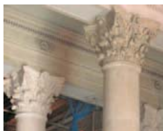
Vor der Behandlung und danach

L. Hietel GmbH & Co. KG Herwigstraße 18 36683 Dillenburg Tel.: 027 71 / 53 62 Fax: 027 71 / 66 72 E-Mail: info@hietel.com Internet: www.hietel.com