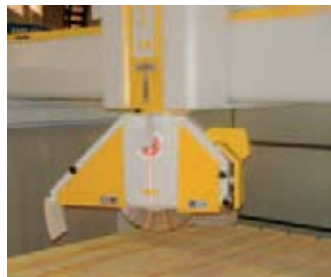
Die neue High-Tech Brückensäge Rotex 39

Vertretung und Service in Deutschland: J. König GmbH & Co. Werkzeugfabrik Dieselstraße 2 76227 Karlsruhe Tel.: 07 21/4 09 05 22 Fax: 07 21/4 09 05 97 E-Mail: Info@j-koenig.de Internet: www.j-koenig.de