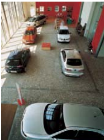
Porphyry im Autohaus

Beim Consorzio Cavatori Produttori Porfido werden Abbau, Produktion, Vertrieb und ggf. sogar die Verlegung komplett »aus einer Hand« organisiert. Ständige Qualitätskontrollen gewährleisten schadensfreie Anwendungen. Geboten werden Bodenbeläge für den Außenbereich in allen Ausführungen; sie sind frostbeständig und auch bei Nässe rutschsicher.