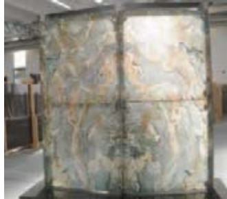
Lichtdurchlässiger LOUISE BLUE

Am 16. Juni fand im Grein Forum in Affi eine Informationsveranstaltung für Planer und Archi-