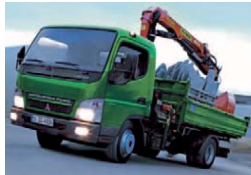
Der neue Canter im Einsatz

Der neue Canter entspricht nach wie vor der steigenden Nachfrage nach einem schmalen, soliden Fahrzeug mit hoher Zuladung, bietet aber jetzt – bei unveränderter Breite – eine wesentlich geräumigere Kabine mit neu gestalteten Sitzen. Auf Wunsch steht ein hydraulisch gefederter Isringhausen-Sitz zur