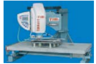
Die T108 S

Verschiedene Innovationen präsentiert der französische Maschinenhersteller Thibaut in Verona: Das Erfolgsmodell T108 wird in der vierten Version präsentiert, die etliche Neuerungen aufweist: eine verstellbare vakuum-gespannte Aluminium-Schablone, ein Vakuum-Spannsystem für die einfache Befestigung des Werkstücks und der Schablone, ein Granit-Arbeitstisch mit automatischer pneumatischer Neigungsverstellung, einen größeren Arbeitsbereich oder den Speicherplatz für 59 Werkzeuge. Auch die CNC-Multifunktionsmaschine T108 A wird mit neuer Ausstattung präsentiert: Sie verfügt jetzt über einen noch größeren Arbeitsbereich in der Y-Achse. Darüber hinaus wurde die Maschine in vielen einzelnen Details verbessert, um sie noch effizienter und leichter bedienbar zu machen. Welche Möglichkeiten die CNC-Technik für die Produktion