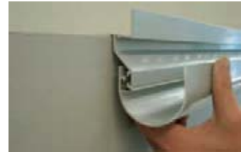
Profil- und Balkonrinnensystem WatecFin

Das Komplettsystem WatecFin aus wertbeständigen Aluminiumprofilen, -rinnen und -fallrohren wurde so konzipiert, dass es sich einfach verarbeiten lässt – ohne Kleben, ohne Löten. Nach dem