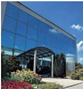
Feiert ihr 40-jähriges Bestehen: die Firma Cereser Marmi Graniti

Auf dem um 1 000 m 2 erweiterten Firmengelände werden neuerdings auch Materialien in Gelbtönen gezeigt. Die Natursteine von Cereser werden in über 30 Länder exportiert. Weltweit suchen erfahrene Mitarbeiter die Materialien aus. Auf der Marmomacc wird Cereser mit Besuchern und Kunden das Jubiläum feiern.