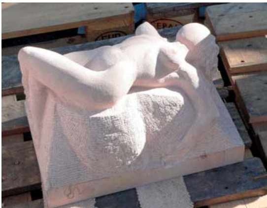
»Vina« von Peter Mühlhäußer