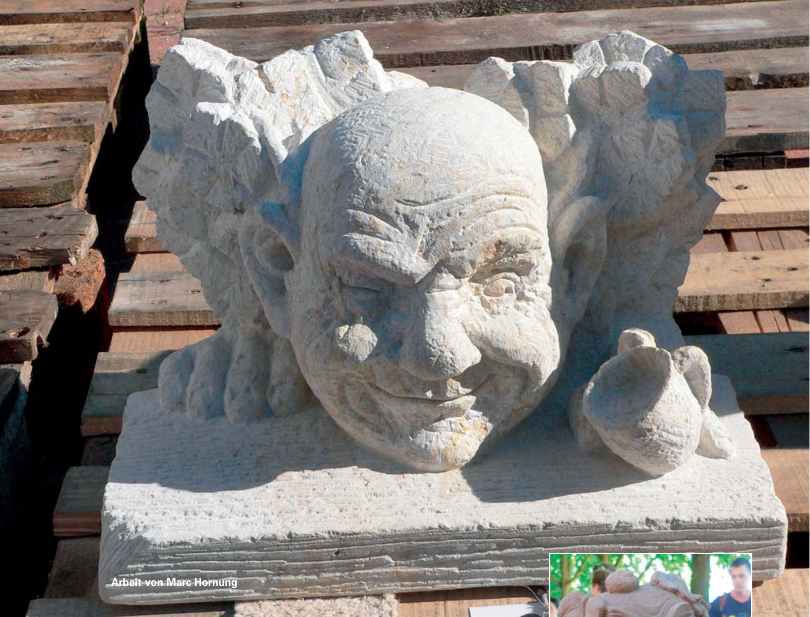
Arbeit von Marc Hornung