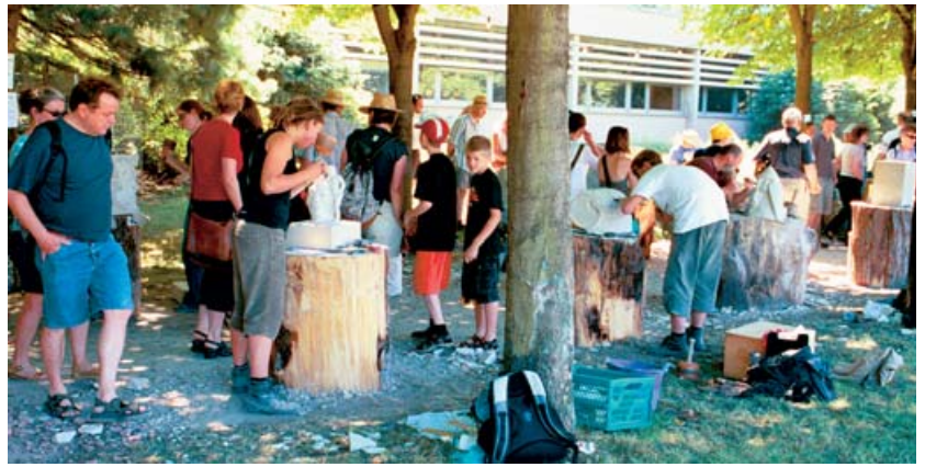
Fleißige Arbeiter bei traumhaftem Wetter.