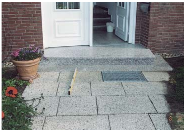
Gesamtansicht der Treppe

Der Sachverständige fertigte nun sein Gutachten an und veranschaulichte seine Aussagen mit aussagefähigen Fotos. Zusätzlich wies er darauf hin, dass geschliffene und polierte Oberflächen im Gegensatz zu rauen Oberflächen im Außenbereich grundsätzlich zu Unfällen führen können. Mit diesem Hinweis entsprach er seiner Pflicht, als Sachverständiger auf die mögliche Gefährdung von Personen aufgrund baulicher Gegebenheiten aufmerksam zu machen.