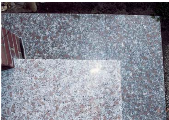
Draufsicht Podest und untere Stufe - durchfeuchtet!