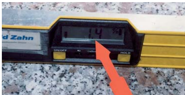
Oberes Podest mit 1,4 % Gefälle