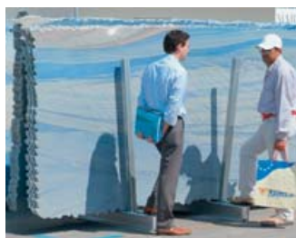
Internationales Forum: CarraraMARMOTEC 2005

berg stattgefunden habe. Die Messe zu Füßen der Marmorberge von Carrara habe den in den letzten Monaten beobachteten relativen Aufschwung bestätigt. Wie die IMM berichtete, sind die italienischen Naturwerksteinexporte im Jahr 2004 wieder angestiegen, und zwar mengenmäßig um 8,4 und wertmäßig um 3,2 %. Die Besucheranalyse hat laut Giancarlo Tonini gezeigt, dass sich die im Nahen und Fernen Osten sowie in Europa durchgeführten Werbemaßnahmen der Messe gelohnt haben. Man habe übrigens unter den Besuchern einen signifikanten Anstieg der Zahl italienischer Bruchbetreiber festgestellt. Car-