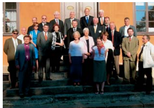
Die EACD- Mitglieder in Gotland

jedem Land, das in der EACD vertreten ist, können höchstens zwei Vertreter entsandt werden. Beschlossen wurde außerdem die assoziierte Mitgliedschaft der EACD in der UEAPME. Die Internationale Vereinigung der Dombaue, Münsterbau-, und Hüttenmeister, kurz: Dombaumeister e. V., und die Dombauhütte am Hohen Dom zu Köln wurden als Mitglieder aufgenommen. Die Amtszeit des Präsidenten wurde von zwei auf drei Jahre erhöht; die nächste Wahl findet 2006 statt.