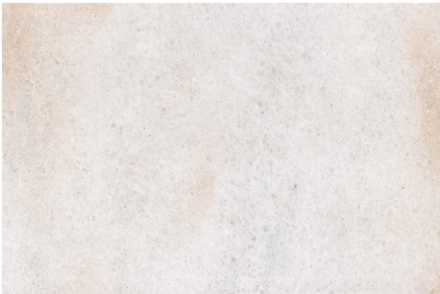
VERDE ROSA KARACASU