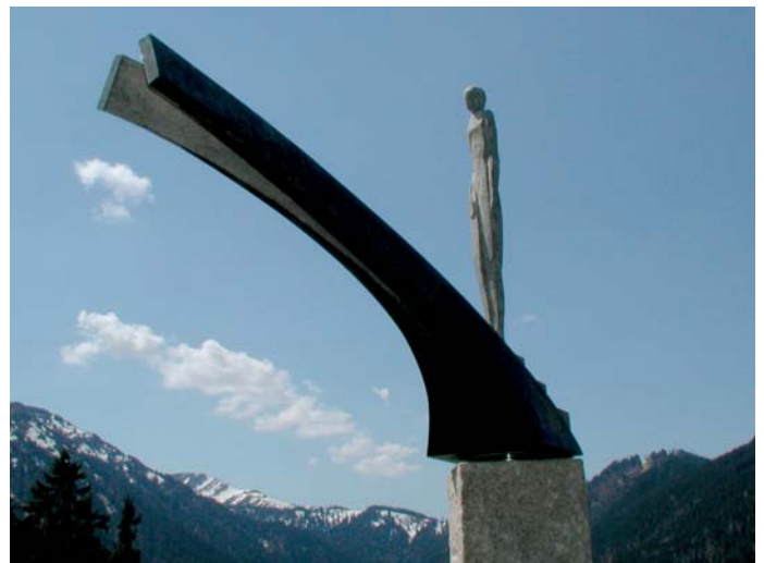
Markus Krischer aus Ottobeuren stellt den Menschen der statischen Architektur entgegen. Die zerbrechliche wirkende Menschendarstellung erklimmt die Architektur wie eine Brücke.