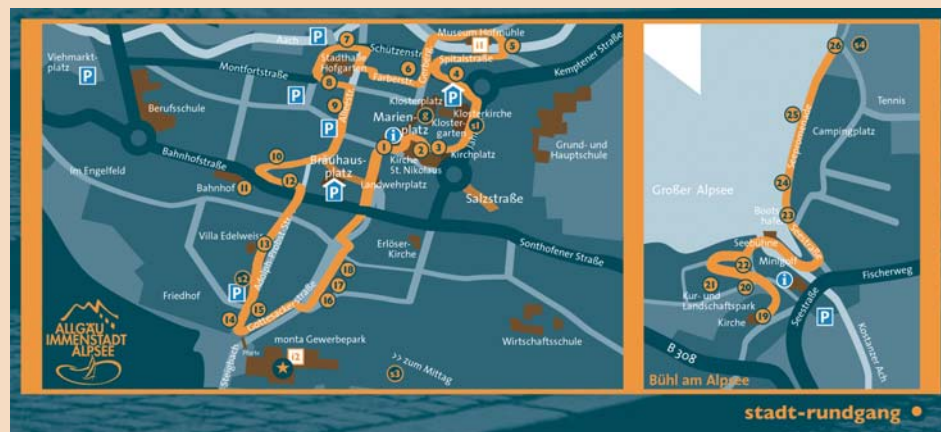
Lageplan: Hier finden sich die Skulpturen in Immenstadt.

Auf der Homepage der Stadt Immenstadt findet man einen virtuellen Rundgang durch die »Stein-Zeit« mit ausführlichen Beschreibungen der Kunstwerke: www.immenstadt.de