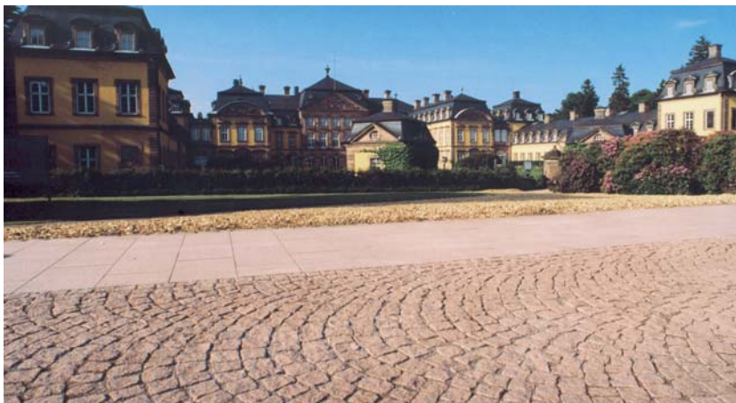
Pflasterplatten und Kleinpflaster aus LÖBEJÜNER PORPHYR, Bad Arolsen