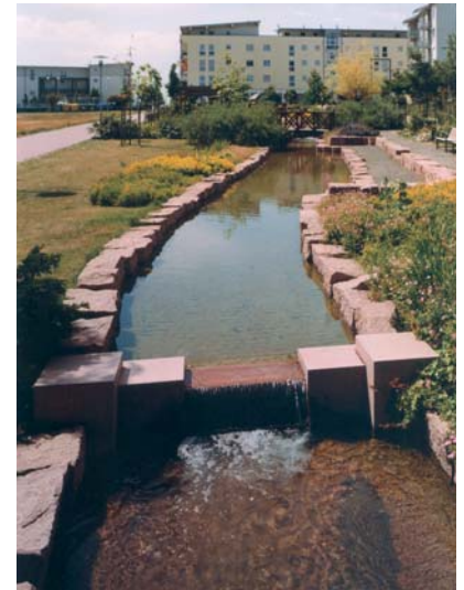
Mit Porphyry gestaltete Gartenanlage in Großkugel bei Leipzig.

Das Gestein weist bauphysikalisch eine günstige Verteilung der Porenradialen auf. Der Hauptteil der Porengrößen liegt zwischen 0,1 bis 0,01 m. Damit verbunden hat der LÖBEJÜNER PORPHYR einen sehr niedrigen w-Wert (0,18 kg/m 3 vh) und gehört somit in die Gruppe der gering saugenden Natursteine; ein kapillares Saugen kann nahezu ausgeschlossen werden. Für den Sättigungsgrad ( S = W_{atm}/W_{vak} ) ergibt sich ein Wert von 0,77 und das Gestein kann damit nach DIN 52106 als witterungs- und frostbeständig bewertet werden. Betrachtet man gleichzeitig dazu den geringen Abrieb (nach