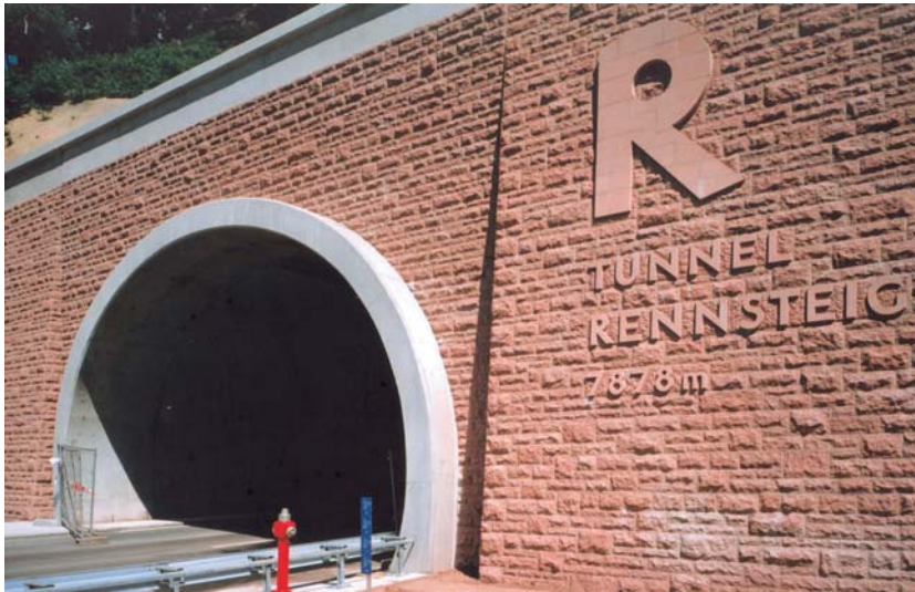
Porphyr-Mauerwerk am Südportal des Rennsteigtunnels bei Oberhof

wicklung setzte 1991 mit der Gründung des Unternehmens Sh Natursteine ein. Heute bietet das Unternehmen v. a. gebrochene, gespaltene und geschnittene Produkte aus LÖBEJÜNER PORPHYR an. Dafür wurden neue Produktions- und Fertigungsanlagen gebaut. Sh Natursteine setzt nicht nur auf Lieferung sondern auch auf die fachliche Planung und die Veretzleistung. Aktuelle Beispiele hierfür sind der Neubau der Dresdner Bank in Halle und die Neugestaltung eines historischen Ensembles für die Martin-Luther Universität Halle (Fachbereiche Mathematik und Geowissenschaften). Im Mittelpunkt dieser Projekte standen fachliche Lösungen für Fassadenbekleidungen. Beispiele für innerstädtische Gestaltungen mit Pflasterplatten und Kleinpflaster (9/11) aus LÖBEJÜNER PORPHYR finden sich in Brehna bei Halle oder Bad