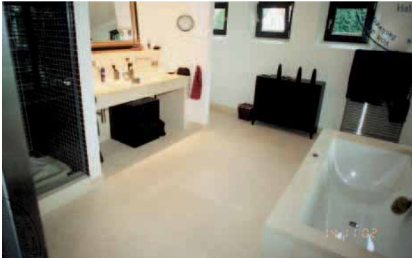
Bodenbelag und Werkstücke aus Sandstein im Bad

zwei Steinmetzen, ein Helfer (Verleger), der damalige Bauleiter des Steinmetzen und ein Sanitärfachmann.