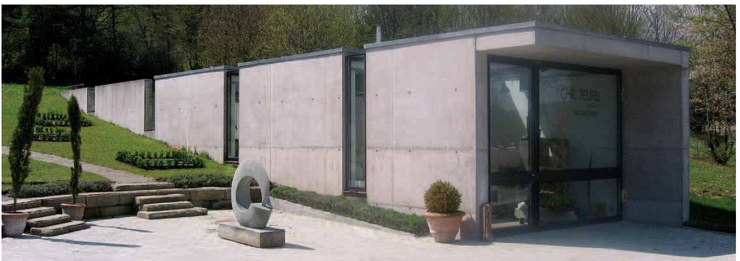
Frank Teufels Atelier