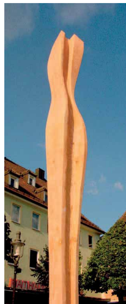
Skulptur »Im Fluss«, Höhe ca. 5 m