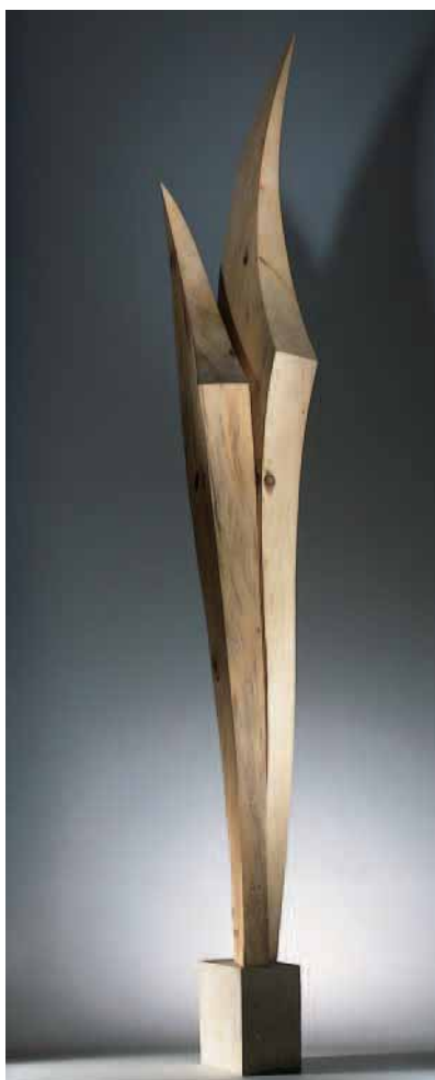
»Die Tanzende II«, Höhe 2,10 cm

»Die Ausstellung fand großen Anklang und hat viele der Besucher zum Nachdenken angeregt«, erklärt Teufel. Die bisher letzte Ausstellung realisierte er Anfang 2005 in seinem Atelier. Er nannte sie »Im Quadrat«. Gemein-