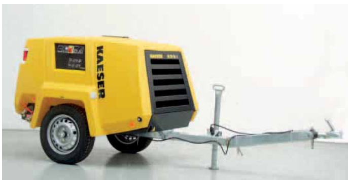
Kompakt, handlich, leistungsstark und wertbeständig: der Baukompressor »Mobilair 26«

Kaeser Kompressoren GmbH Postfach 2143 96410 Coburg Tel.: 095 61/64 00 Fax: 095 61/64 01 30 Internet: www.kaeser.com