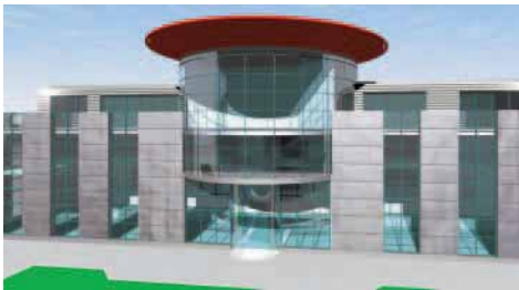
So soll der Neubau aussehen, wenn er fertig ist.

Steinmetzbetriebe Bamberger Wr. Neustädter Str. 137-139 A-2514 Traiskirchen Tel.: 00 43 / (0) 2 25 28 05 21 Fax: 00 43 / (0) 22 52 85 35 2 E-Mail: bamberger@naturstein.co.at Internet: www.marmorwelt.com