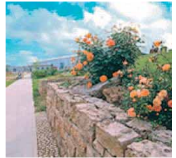
Mauern setzen Akzente.

Mauern aus massiven Steinen haben nicht nur einen hohen praktischen Wert als Böschungs-, Stütz- und Grenzmauern, sie ermöglichen auch ästhetische und abwechslungsreiche Gartengestaltungen. Aus diesem Grund erleben Mauern aus Kalk- und Sandstein gegenwärtig eine wahre Renaissance.