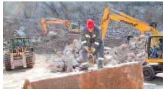
Ein Blick in den Steinbruch

Die VSG Schwarzwald-Granit-Werke GmbH & Co. KG hat am 16. April einen Steinbruch-Aktionstag in Raumünzach im Nordschwarzwald veranstaltet. Dabei konnten sich Besucher darüber informieren, wie Steinprodukte entstehen. Vorgeführt wurde der Prozess von der Sprengung bis hin zum Fertigprodukt. »Unsere Gäste sollten im Zeitraffer jeden Schritt wie