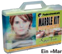
Ein »Marmorset« für den Hausgebrauch

Die Firma Federchemicals hat auf der Stone+tec ein neues »Marmorset« präsentiert. Das »Marmorset« ist ein praktisches Köfferchen für den Hausgebrauch. Es enthält drei Spezialprodukte zum Schutz und zur Pflege von Marmor, Agglomerat, Granit und anderen Natursteinen mit patinierten und polierten Oberflächen. Ein kleiner Ratgeber erleichtert den Umgang mit den Produkten. Das Set eignet sich für die Bearbeitung von Küchenarbeitsplatten, Waschi-