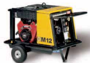
Für mobilen und flexiblen Druckluft-Einsatz: »Mobilair 12«