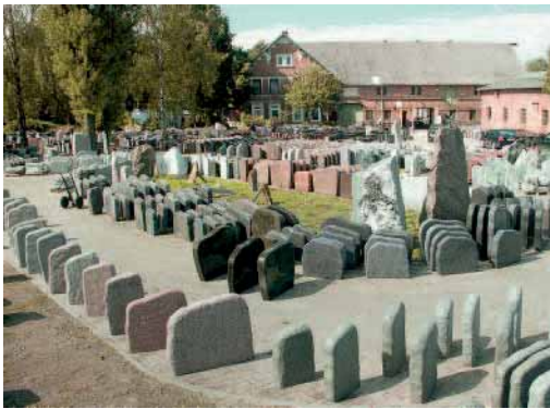
Ein Lagersortiment von über 12 000 Grabmalen ermöglicht eine Belieferung der Kunden binnen zwei Wochen.