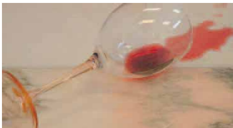
Behandelte Flächen sind gegen Säuren geschützt.

Clean-Produkt Vertrieb GbR Max-von-Laue-Str. 3 52499 Baesweiler Tel.: 024 01/6 03 04 11 Fax: 024 01/89 69 86