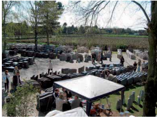
100 Steinmetzen feierten das Jubiläum der H & R Naturstein-Vertriebs GmbH in Bönningstedt.