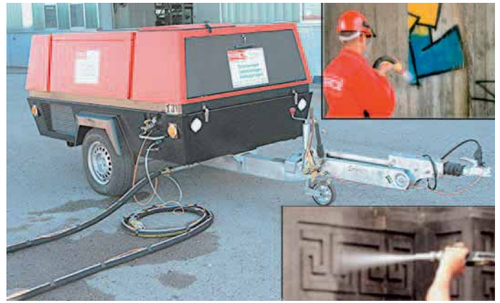
Das neue Mobil-Vario-Car von SAPI

ner Flächen wie z.B. beim Entfernen von Graffiti oder beim Aufrauen von rutschigen Oberflächen (polierte Natursteine etc.). Das Mobil eignet sich auch für die Grabsteinreinigung. In das Mobil-Vario-Car ist das bewährte Mammut-Druckstrahlgerät mit 100 l-Fassungsvermögen integriert. Die Aktivierung bzw. Deaktivierung des Druckstrahlgeräts erfolgt über einen Reedkontakt am Strahlschlauch unmittelbar vor der Strahldüse. Das Mobil ist mit modernster variabler Düsenteknik ausgestattet. Mit einer Basisdüse können drei verschiedene Strahltechniken ausgeführt werden: die Venturi-Strahltechnik, die Flachstrahltechnik und die