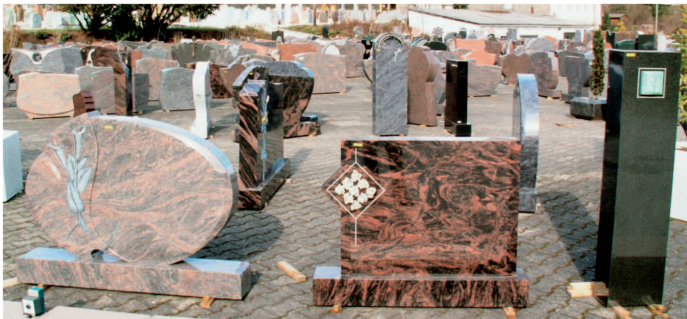
Breitsteine und Stelen bei Dassel.