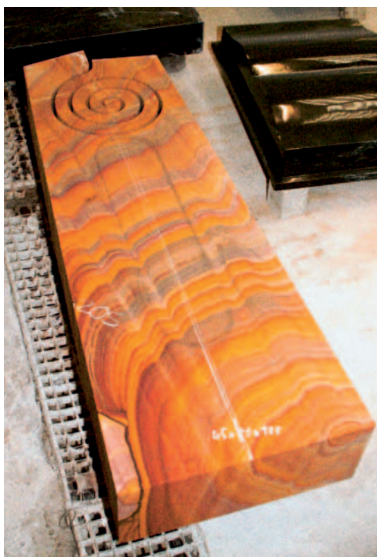
Indischer Sandstein, noch im »Versuchsstadium«.