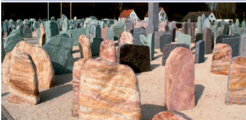
Felsenausstellung des NKA.