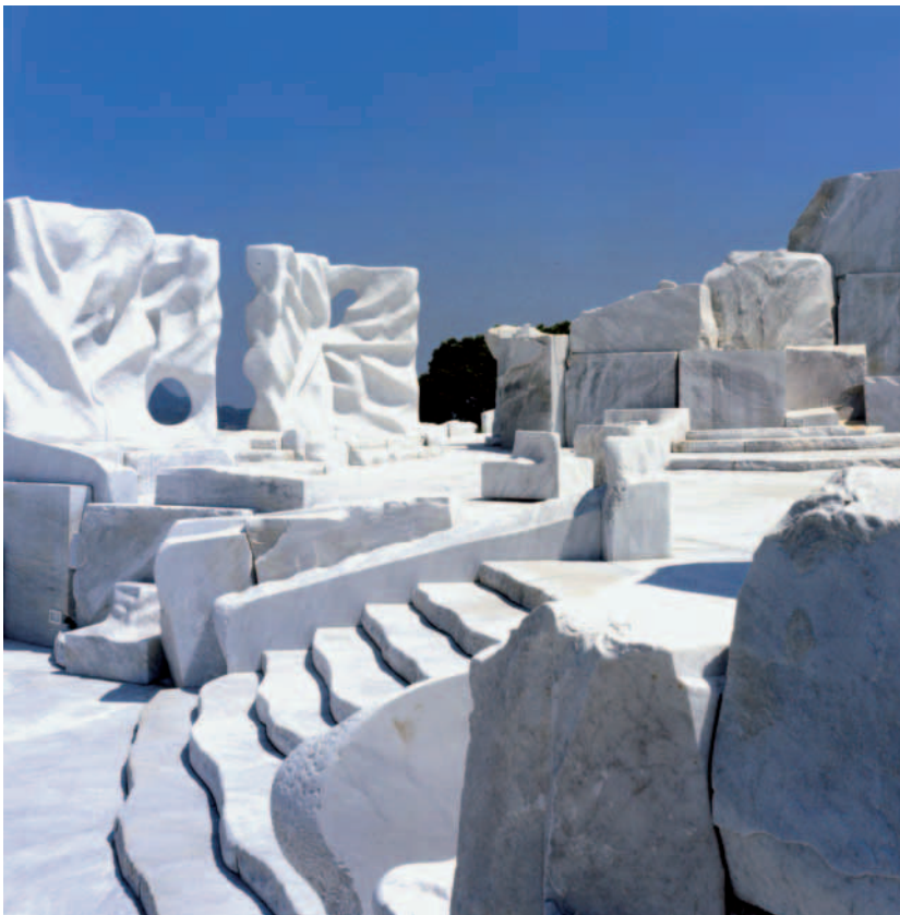
1. Preis in der Kategorie »Gestaltung des öffentlichen Raums«: Kazuto Kuetani für seinen »Hügel der Hoffnung« in Hiroshima.