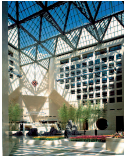
1. Preis in der Kategorie »Innenausbau«: Pei Partnership Architects LLP für die Zentrale der Neuen Bank von China in Peking.