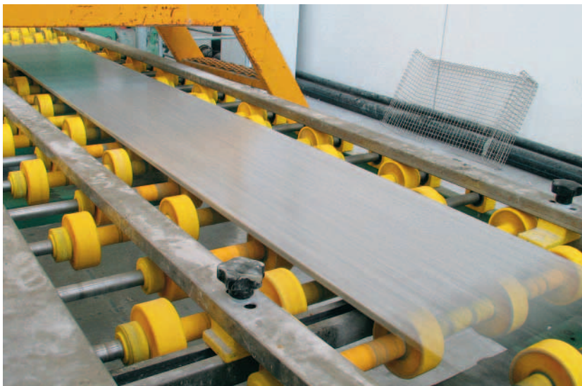
Detailansicht der neuen Marmorfliesenstraße.