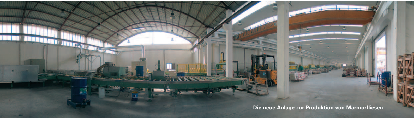
Die neue Anlage zur Produktion von Marmorfliesen.