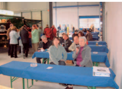
Die Hausmesse war gut besucht.

Just GmbH & Co. Naturstein KG Chemnitzer Straße 6 04764 Hartha Tel.: 03 43 28/7 04 40 Fax: 03 43 28/7 04 99 E-Mail: verkauf@just-naturstein.de Internet: www.just-naturstein.de