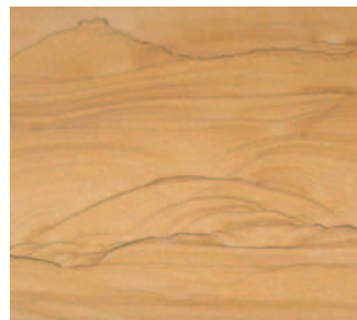
Neu im Sortiment: ASIA DORATO aus China.