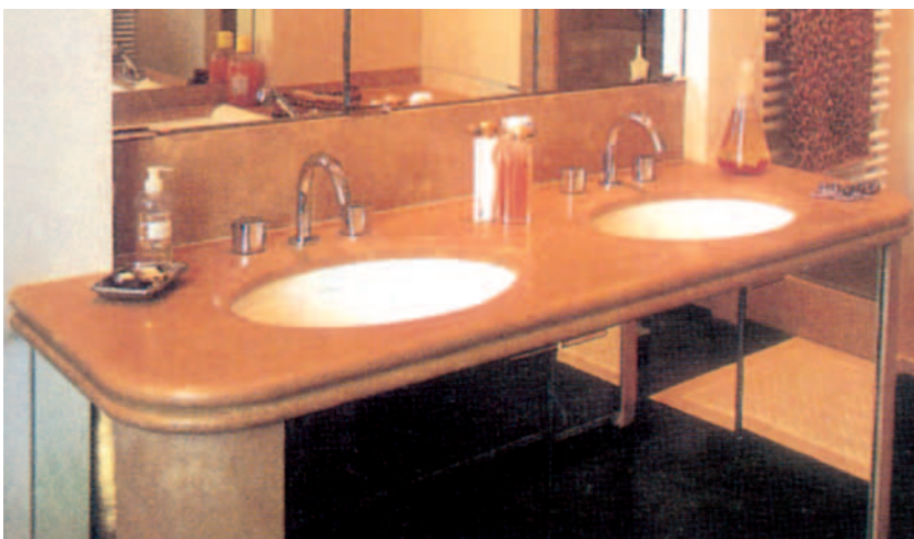
Von Xiamen Chiefstone gefertigter Waschtisch.