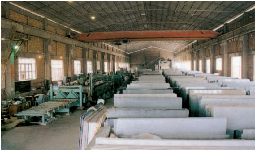
Blick in eine von vielen Produktionshallen der Firmengruppe Xiamen Chiefstone.