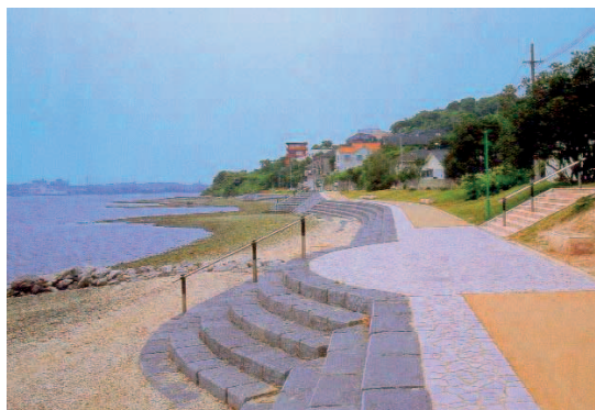
Hafenanlage in Hakata, Japan, gefertigt aus IMPALA BLACK und WHITE BEAUTY.

Das Unternehmen hat bereits für eine große Reihe internationaler Bauprojekte als Natursteinlieferant gewirkt und dabei tragfähige Geschäftsbeziehungen mit international bedeutenden Natursteinhandelsfirmen geknüpft, berichtet Cindy Shao. Zu den Referenzobjekten von Xiamen Chiefstone gehören das Four Seasons Hotel in Miami, USA (u. a. Waschtische und Bodenfliesen aus EVER GREEN und BLACK ABSOLUTE), die Drury Inn & Suites Hotels, USA (Waschtische, Bodenfliesen und Wandbekleidungen), der Maya Seaside Place in Kobe, Japan (Skulpturen aus Granit