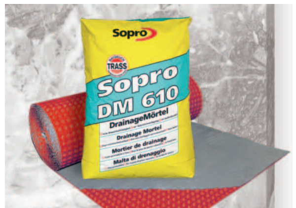
Sopro DrainageMatte und Sopro DrainageMörtel.