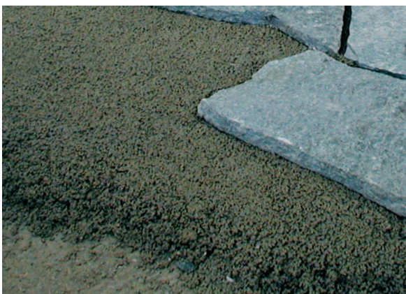
Verlegung eines Natursteinbelags auf einer Terrasse mit Sopro DrainageMörtel.