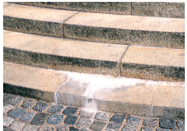
Kalkausblühungen auf einer Außentreppe.