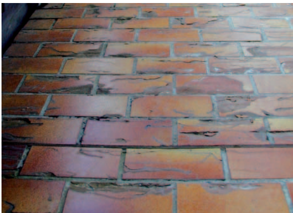
Zerstörung eines Fliesenbelags durch Frostschäden infolge unzureichender Entwässerung.

Wer Schäden vermeiden will, muss ein geeignetes Verlegesystem wählen. Die höchste Sicherheit bieten im Außenbereich die Systeme, durch die das eindringende Wasser gezielt und rasch abgeführt werden kann.