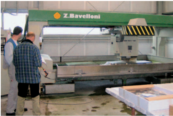
Ohne ihr Bearbeitungszentrum könnte die Firma längst nicht so effizient arbeiten wie sie es tut.