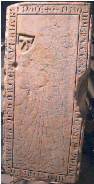
Das Sterbedatum der Alberna von Horne ist auf der restaurierten Ritzgrabplatte auf 1320 datiert. Das erhaben ausgearbeitete Wappen zeigt zwei gekreuzte Hörner.