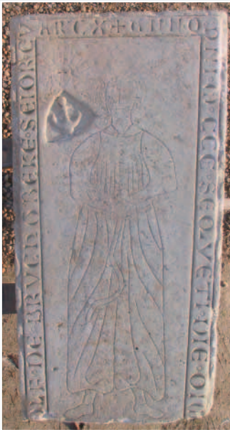
Grabplatte des Rudolf von Brochterbeck dem Älteren nach der Restaurierung. Sein Sterbedatum ist auf 1300 datiert. Die figürliche Darstellung ist als Nut eingehauen. Das Schriftband zeigt kräftig eingeschnittene Majuskeln mit h-Minuskeln.