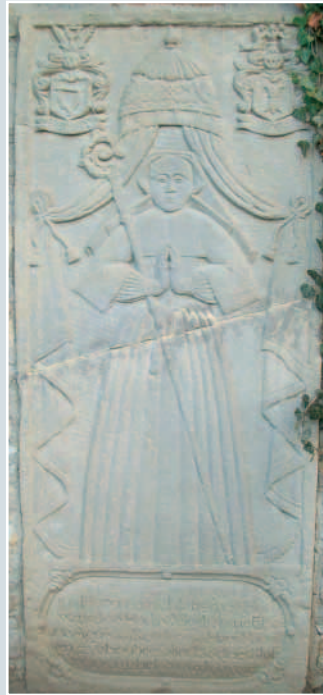
Vor der Restaurierung klangte in der Mitte der Grabplatte ein tiefer Riss. Durch Stauwasser war es an der Sockeloberkante zu Feuchteschäden und Mooswachstum gekommen.