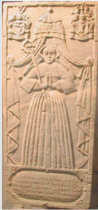
Die Grabplatte der Äbtissin Agnes von Ketteler nach der Restaurierung.