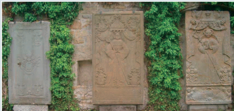
Weitere restaurierte Grabplatten an der Klostermauer.

ritzungen nach dem gleichen Schema ohne künstlerische Weiterentwicklung erfolgten. Denkbar wäre die Werkstatt von Niemann aus Bevergern.