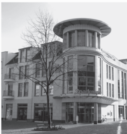
Sparkasse Viersen, Zweigstelle Süchteln