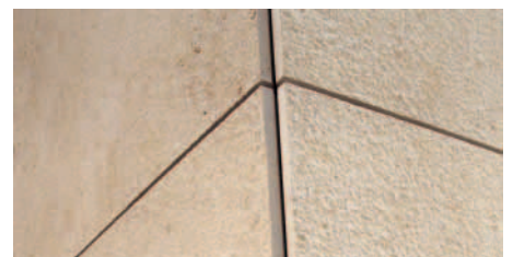
Detail der Fassade der Godesberger Allee 2.

Schild eine über vier Seiten lange Liste der in den letzten elf Jahren ausgeführten Arbeiten. Zu allen Objekten finden sich Angaben zu Material und Menge, viele sind mit mehreren Fotos abgebildet. Eine Suchmaschine erleichtert die Orientierung. »Vor allem Architekten nutzen diese Art der Präsentation. Wir haben sehr viel Erfolg mit unserer