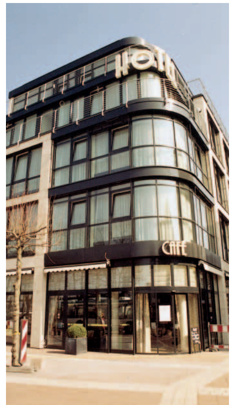
Hotel in Siegburg mit JURA-Fassade, geliefert von der Firma Stiegler.

Ohne gutes Controlling geht es nicht«, betont der Geschäftsführer. »Die Tatsache, dass wir schon Anfang 2000 mit dieser Art der Kalkulation angefangen haben, hat uns vor Verlusten bewahrt«. Als weiteren Grund des Erfolgs nennt Rausch die professionelle Internet-Präsentation des Unternehmens. Unter dem Link »Referenzen« zeigt Rausch &